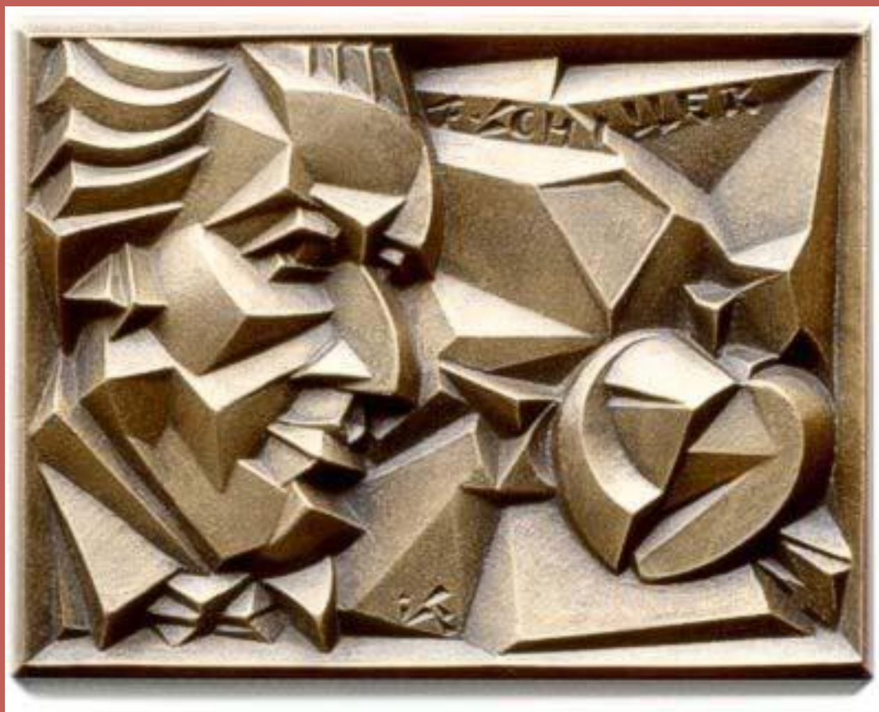
Рельєф «Фрідріх Шиллер», 1991