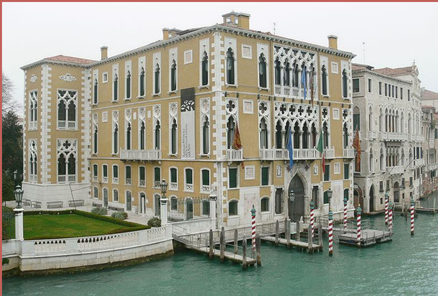
Палаццо Каваллі-Франкетті, Венеція