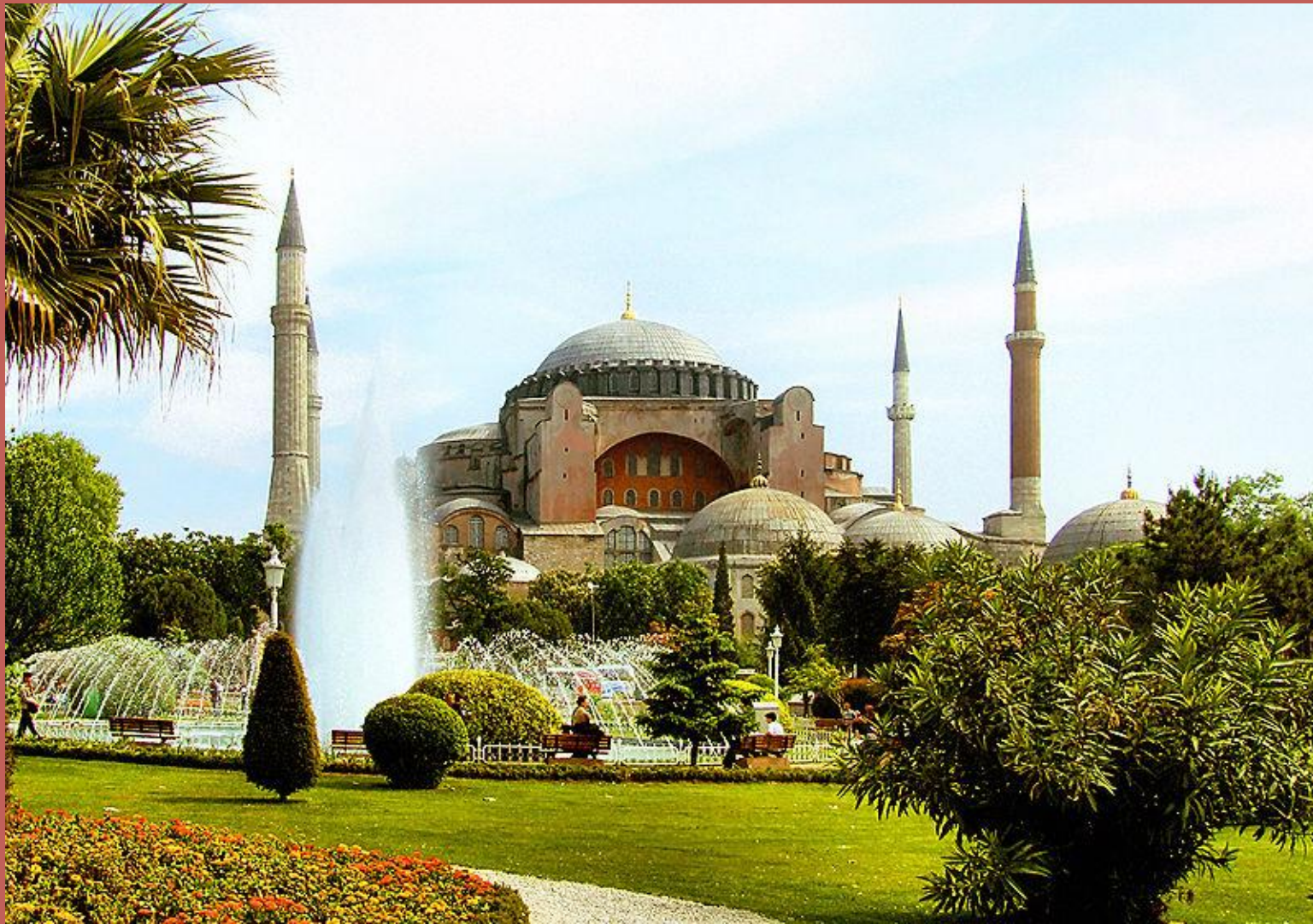
Собор Святої Софії, Константинополь