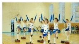
ДОСТУПНОСТЬ ВУЗА ДЛЯ ЛИЦ С ОГРАНИЧЕННЫМИ ВОЗМОЖНОСТЯМИ И ИНВАЛИДОВ