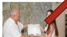
ИНФОРМАЦИЯ О СВОБОДНЫХ БЮДЖЕТНЫХ МЕСТАХ