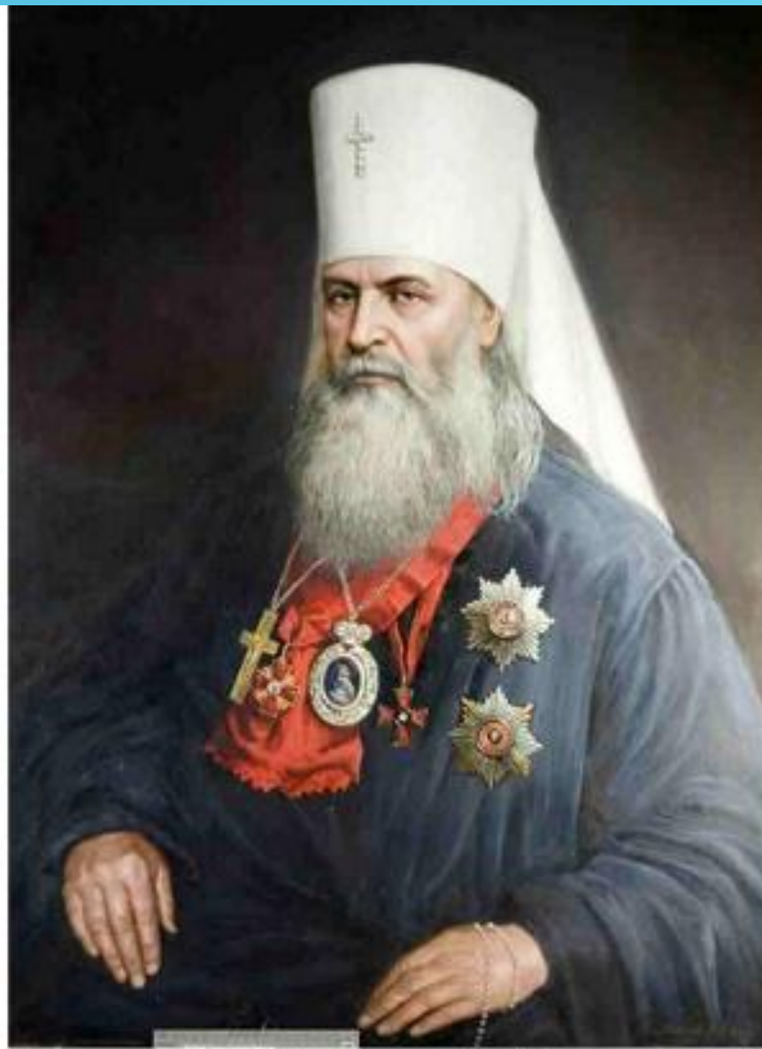
Митрополит Московский и Коломенский Макарий. С портрета В. Шилова