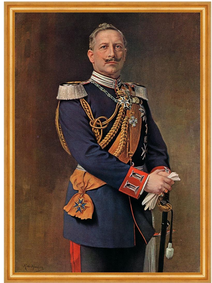
Вильгельма II (1888-1918)

Кайзер мечтал о величии Германии. При нём резко выросли националистические настроения, усилилось насильственное онемечивание поляков. Преклонение перед военными достигло апогея. Германия вооружалась, а общество было ослеплено блеском немецкого оружия. Большой популярностью пользовались военные парады, на выходные семьи посещали памятники немецким победам, детей одевали в некое подобие военной формы — матросские костюмы. Зрела подспудная готовность к войне.