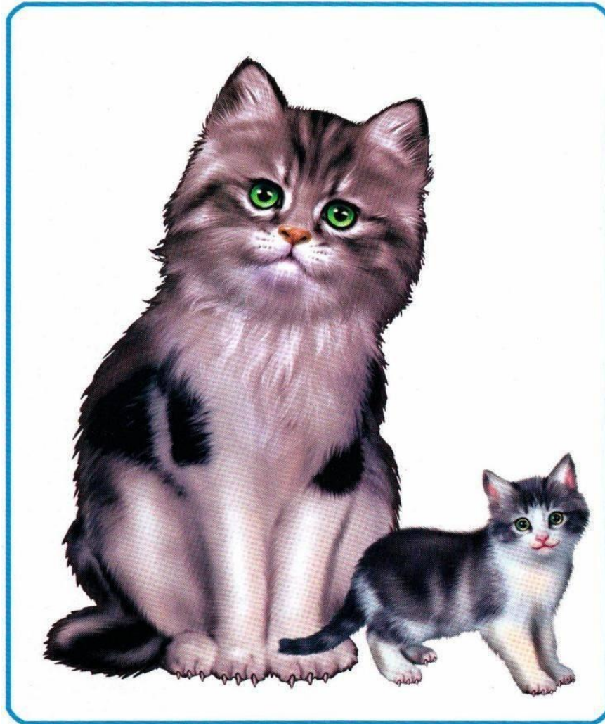
КОШКА И КОТЁНОК