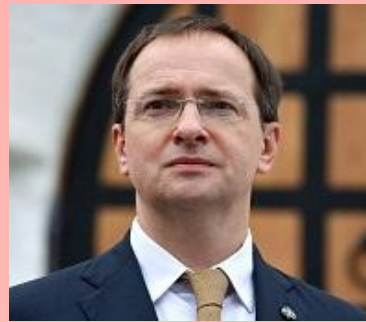
Мединский Владимир Ростиславович