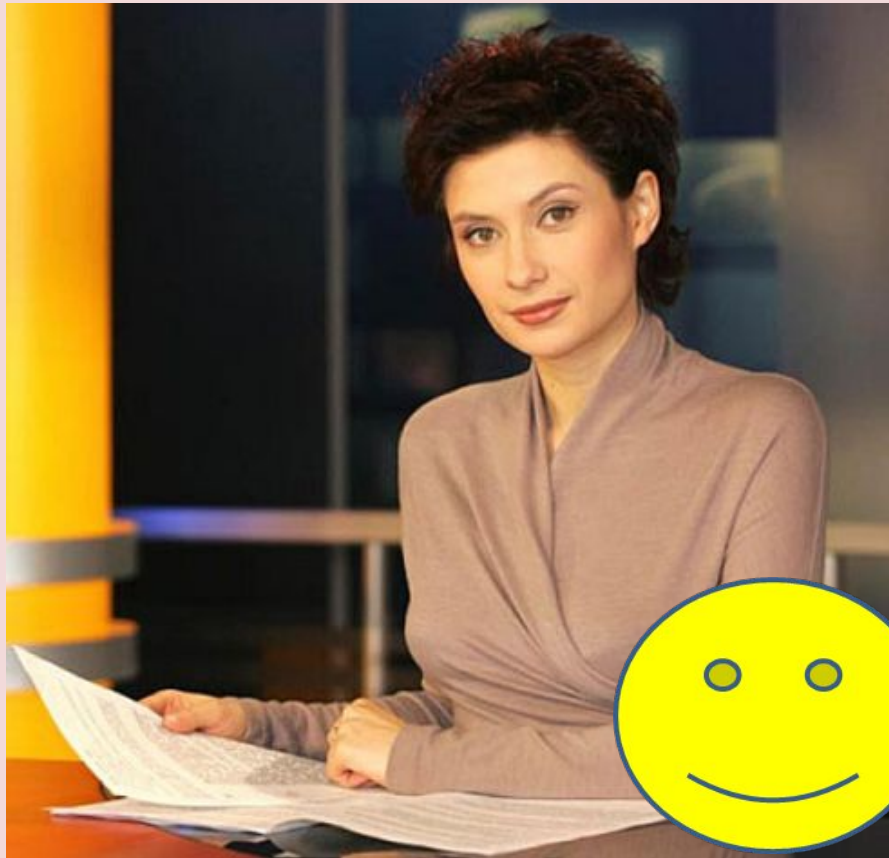
ФОТО – НЕ ОБЯЗАТЕЛЬНО, НО ДЛЯ РЯДА ДОЛЖНОСТЕЙ ЖЕЛАТЕЛЬНО