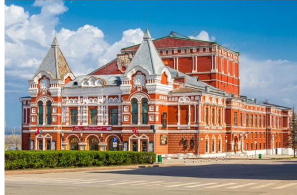
Самарский драматический театр