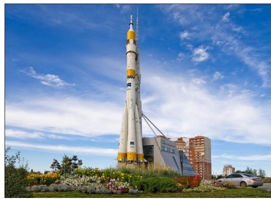
Музей «Самара космическая»