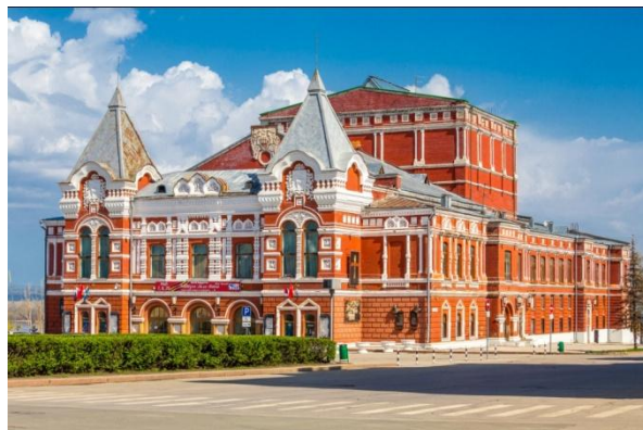
Самарский драматический театр