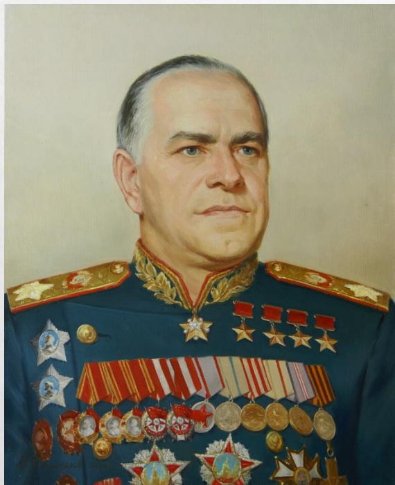
Жуков Георгий Константинович- Маршал Советского Союза, командующий 1-ым Белорусским Фронтом