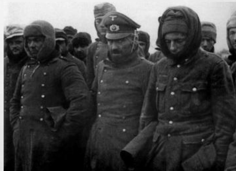
Пленные немцы 1945 год