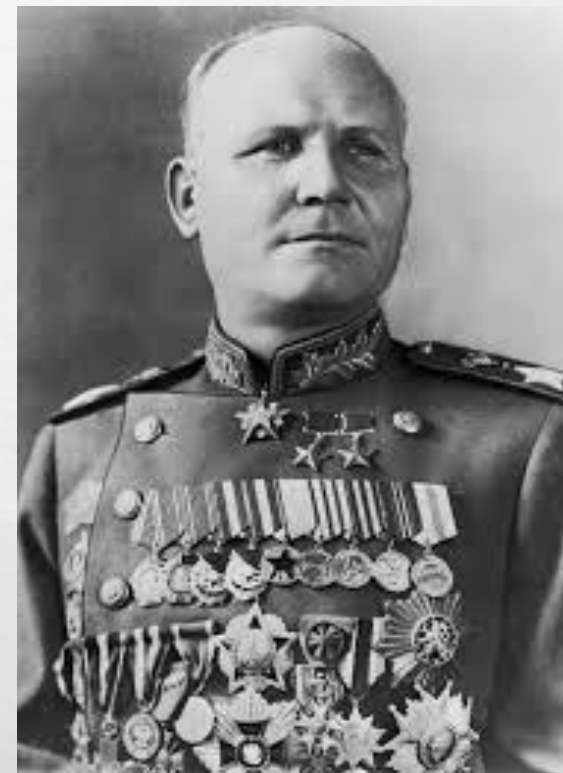
Конеv Иван Степанович- Маршал Советского Союза, командующий 1-ым Украинским Фронтом