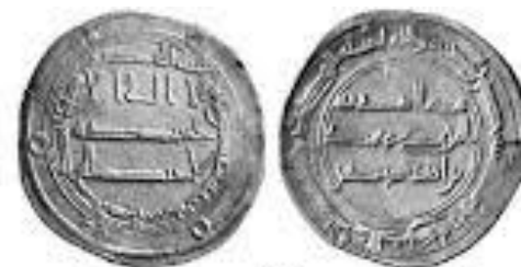
С надписью "Ардар Хазар"