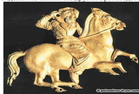
Золотая бляха с изображением конного скифа. IV век до н.э. Курган Куль-Оба.