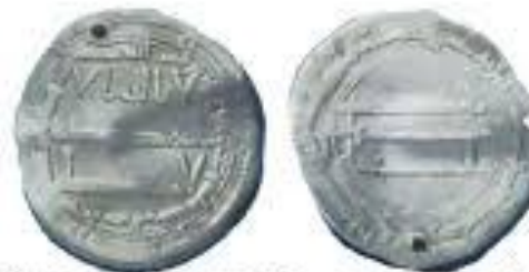
С надписью Моисей — посланник Бога