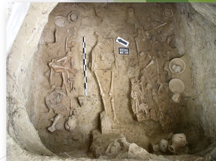
Предположительно аланское погребение. IV в. н.э.