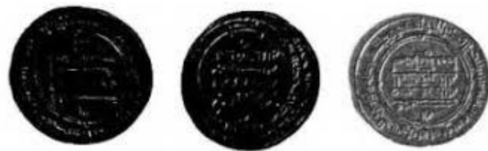
Арабские дирхемы. Серебро. Династия Саманидов. Начало X в. ГИМ