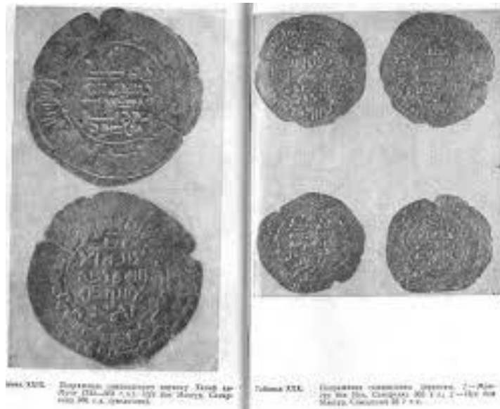
рис. XIII. Дирхем (серебро) Хазар ар-Руби (Павловск) 911-1011 гг. Мундх, Самарканд 96 г. С.А. Стамбульск.