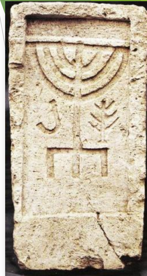
Иудейское надгробие из станции Тамань.