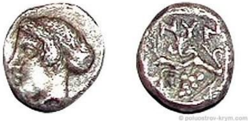
Нимфей. Диобол. V в. до н.э.