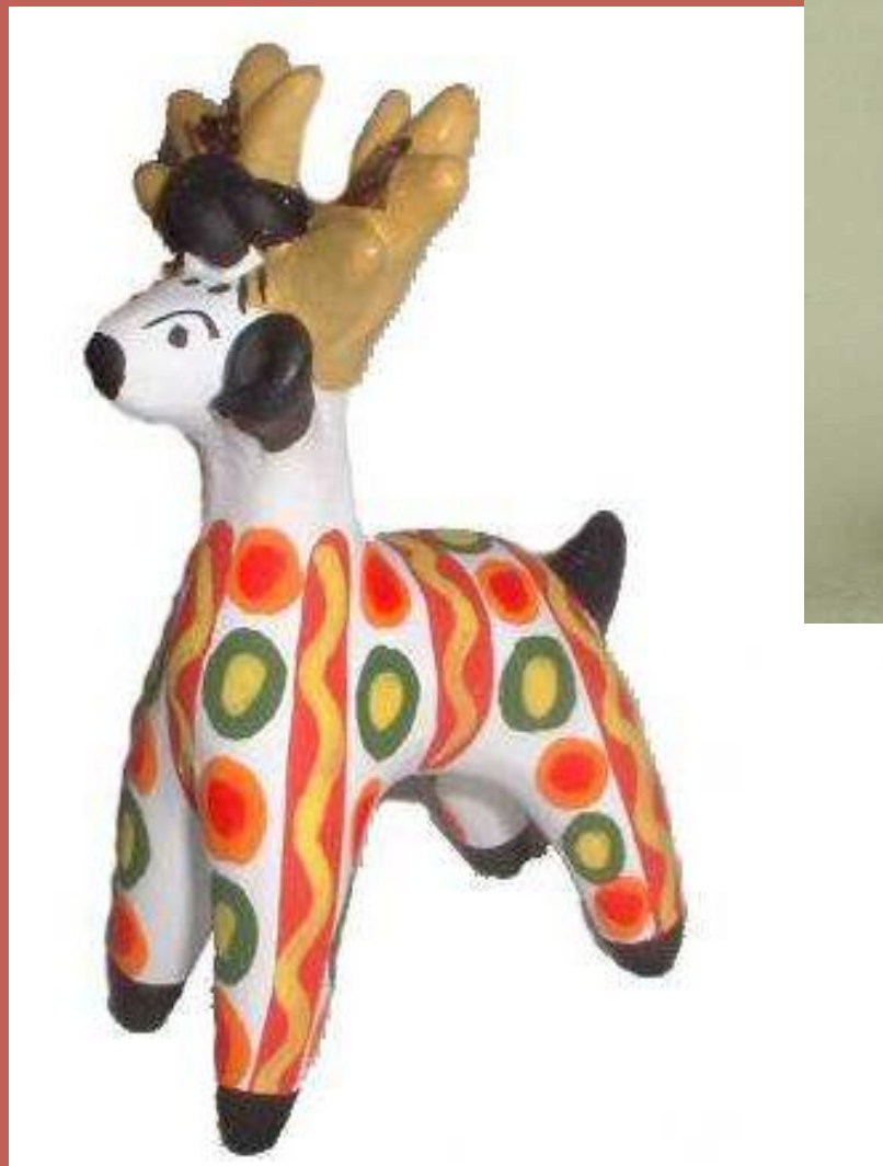
Олень -золотые рога