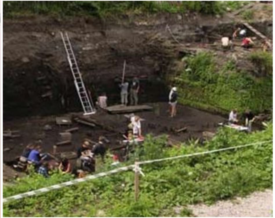
Раскопки улиц Великого Новгорода