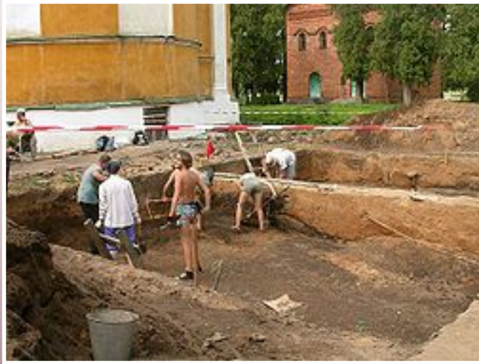
Археологические раскопки на территории кремля в Угличе

История России своими корнями уходит в глубокую древность. В 6 классе изучается та часть родной истории, охватывающая период с древних времён до конца XVI (16) века.