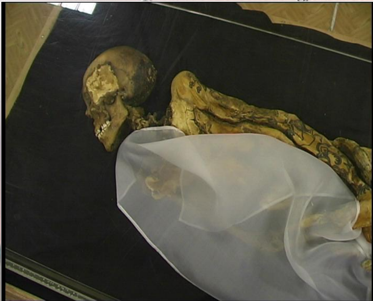
Мумия Алтайской принцессы