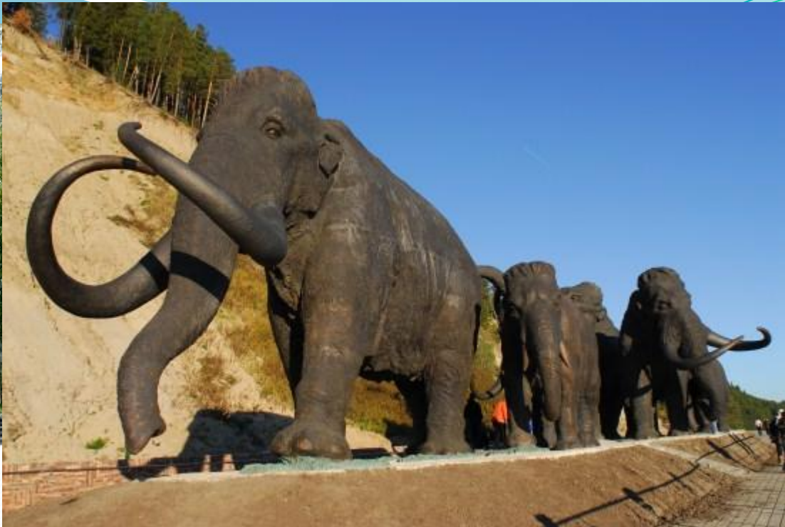
Культурно-туристический комплекс "Археопарк"