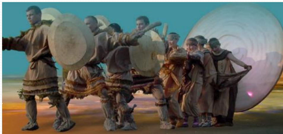
Театр обско-угорских народов