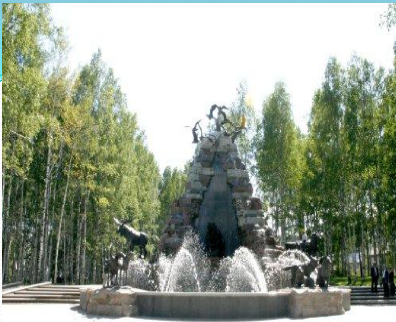
Фонтан "Обь и Иртыш"