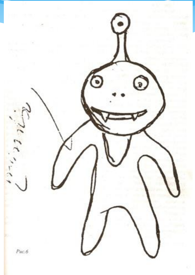
Рисунок помещен в углу – депрессия.

Рисунок выходит за край листа – импульсивность; острая тревога.