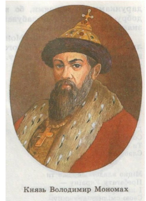
Князь Володимир Мономах