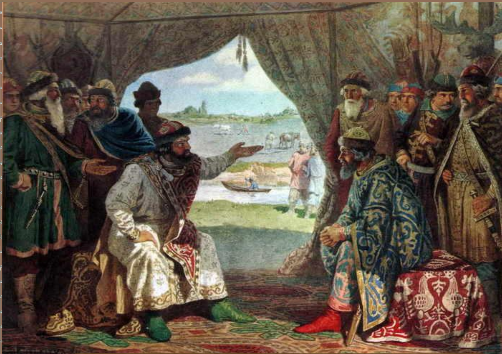
Алексей Кившенко. «Владимир Мономах на совете князей»