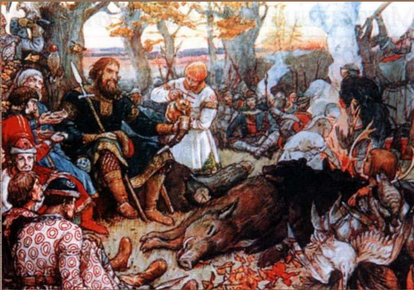
В.М. Васнецов. «Отдых великого князя Владимира Мономаха после охоты»