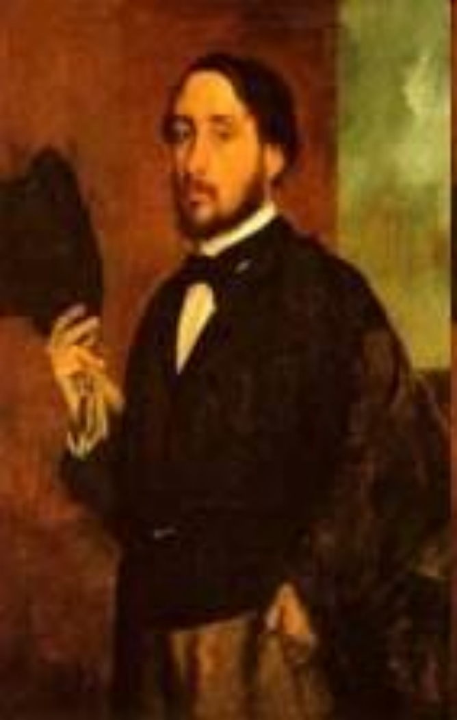
Эдгáр Дегá (1834 — 1917)