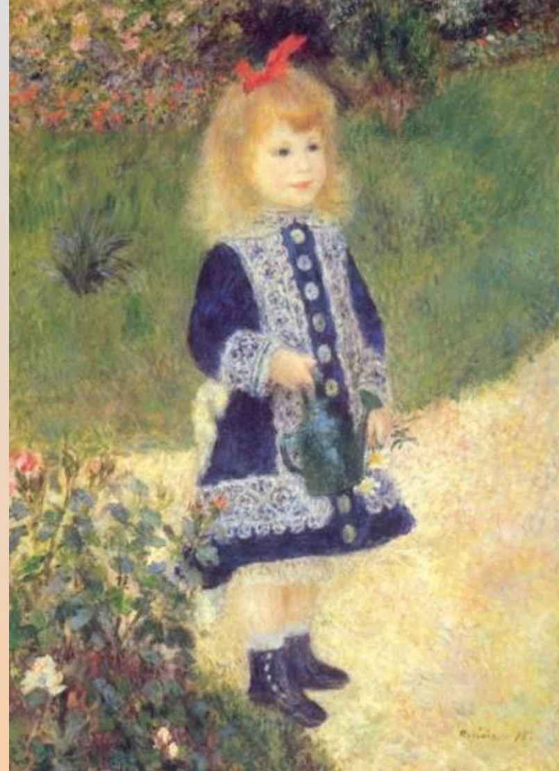
Девочка с лейкой