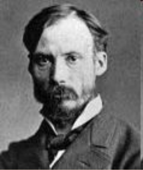
Пьер Огюст Ренуар (1841—1919)