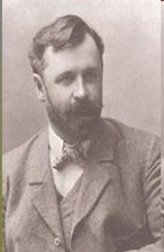
Константи́н Алексе́евич Коро́вин ( 1861 — 1939)