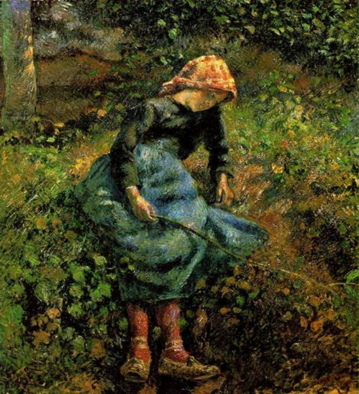
Девочка с веткой