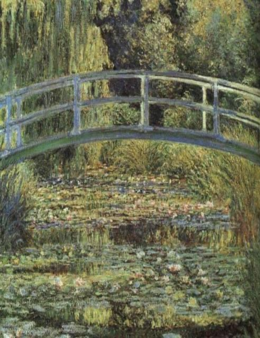
Пруд с лилиями