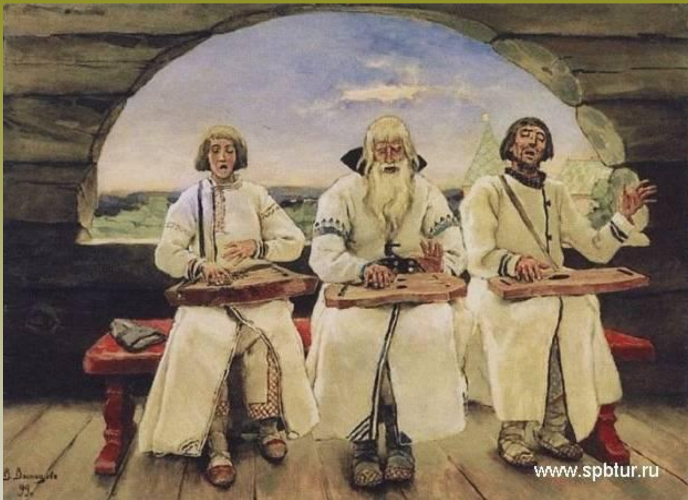
В. Васнецов. Гусли.