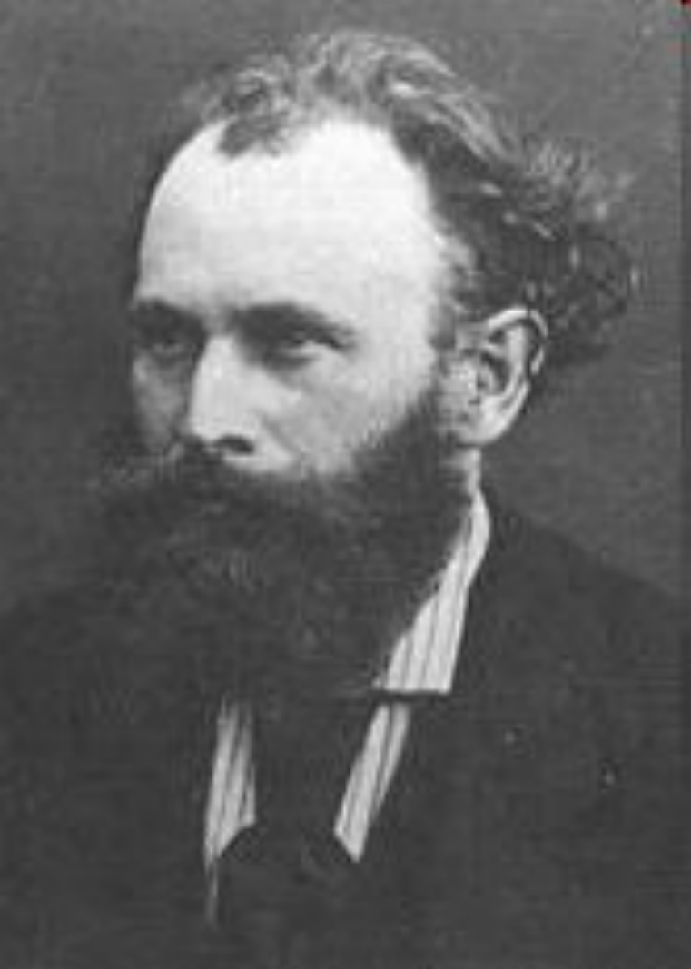
Эдуард МАНЕ (1832-1883)