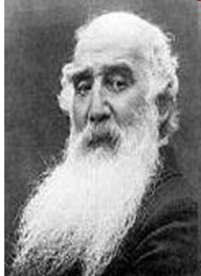
Каміль Жакоб Писсаро́ (1830—1903)