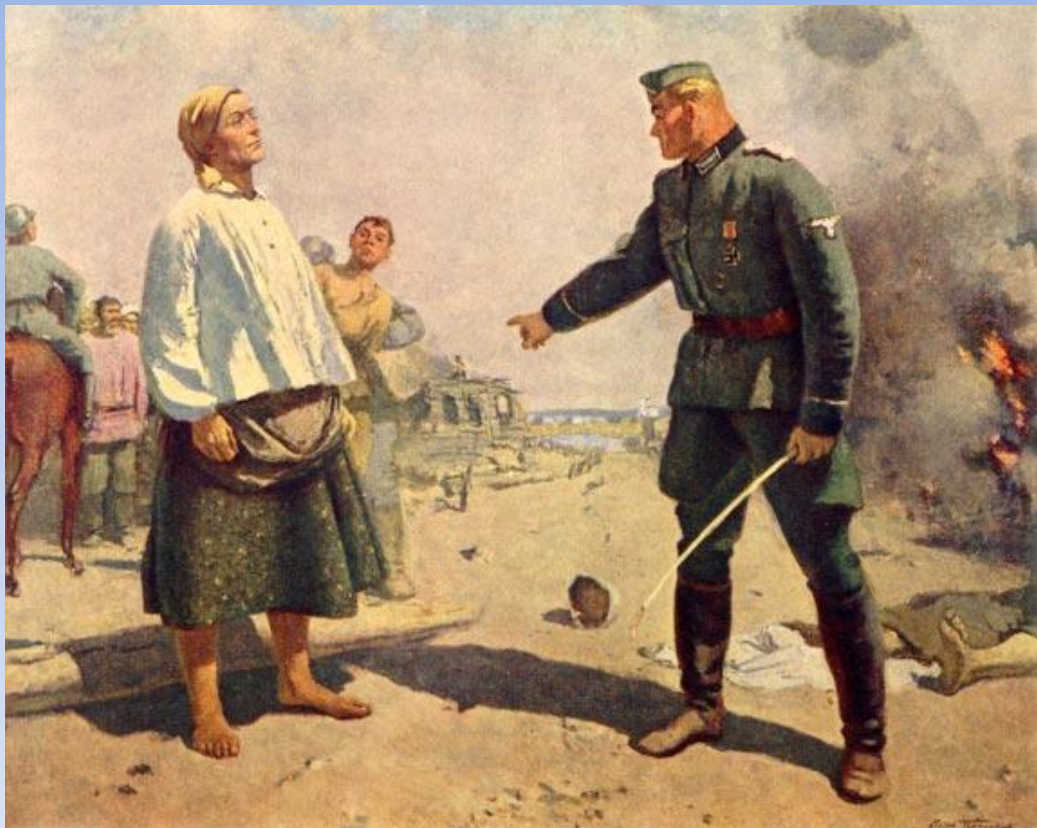
5.6. С.М.Герасимов «Мать партизана» 1942г., х.м., Государственная Третьяковская галерея