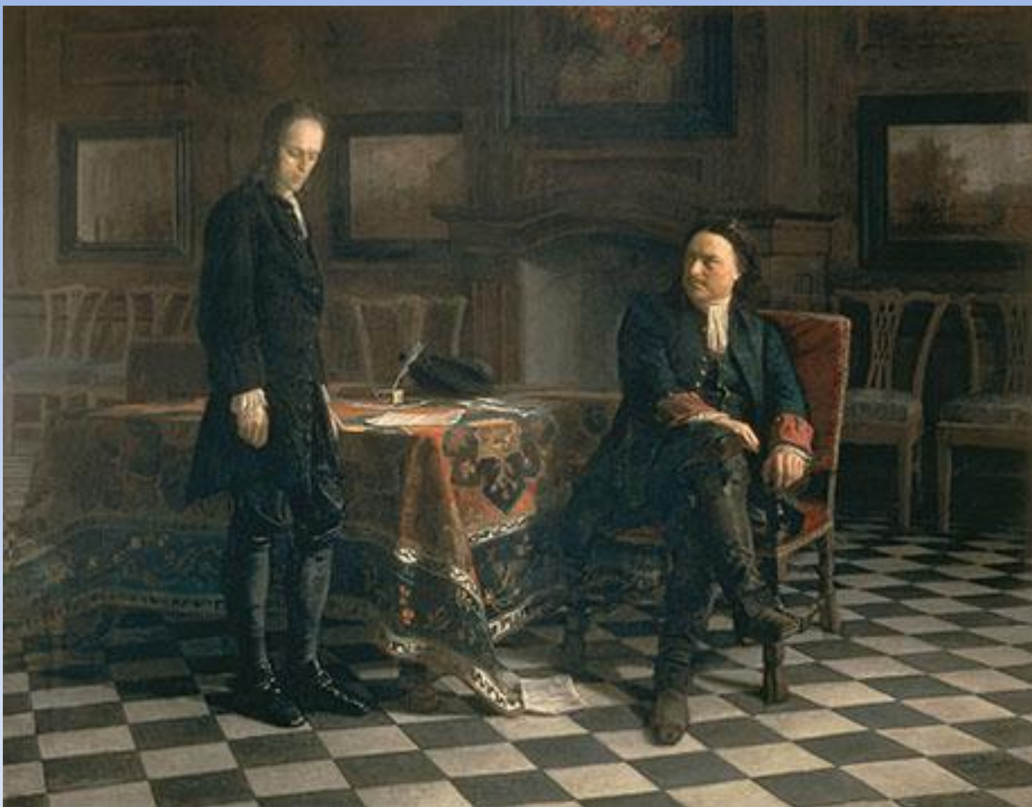
5.4. Н.Н.Ге «Пётр допрашивает царевича Алексея в Петергофе» 1871г., х.м., Государственный Русский музей