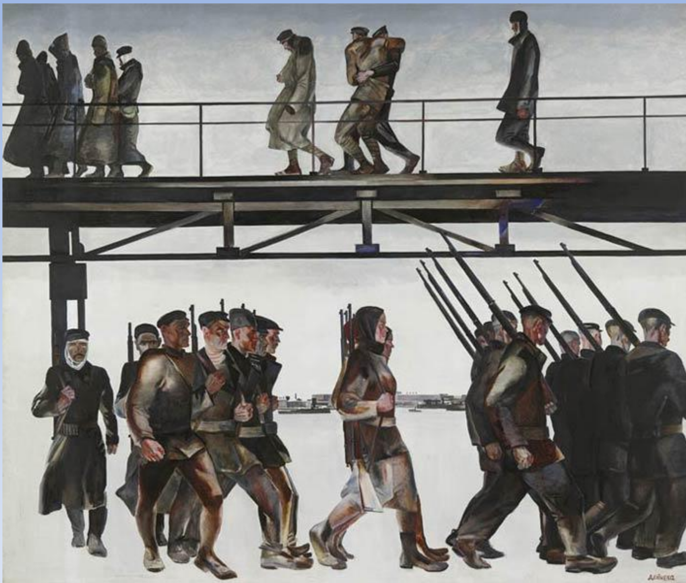
5.5. А.Н.Дейнека «Оборона Петрограда» 1928г., х.м., Центральный музей Вооруженных Сил России, Москва