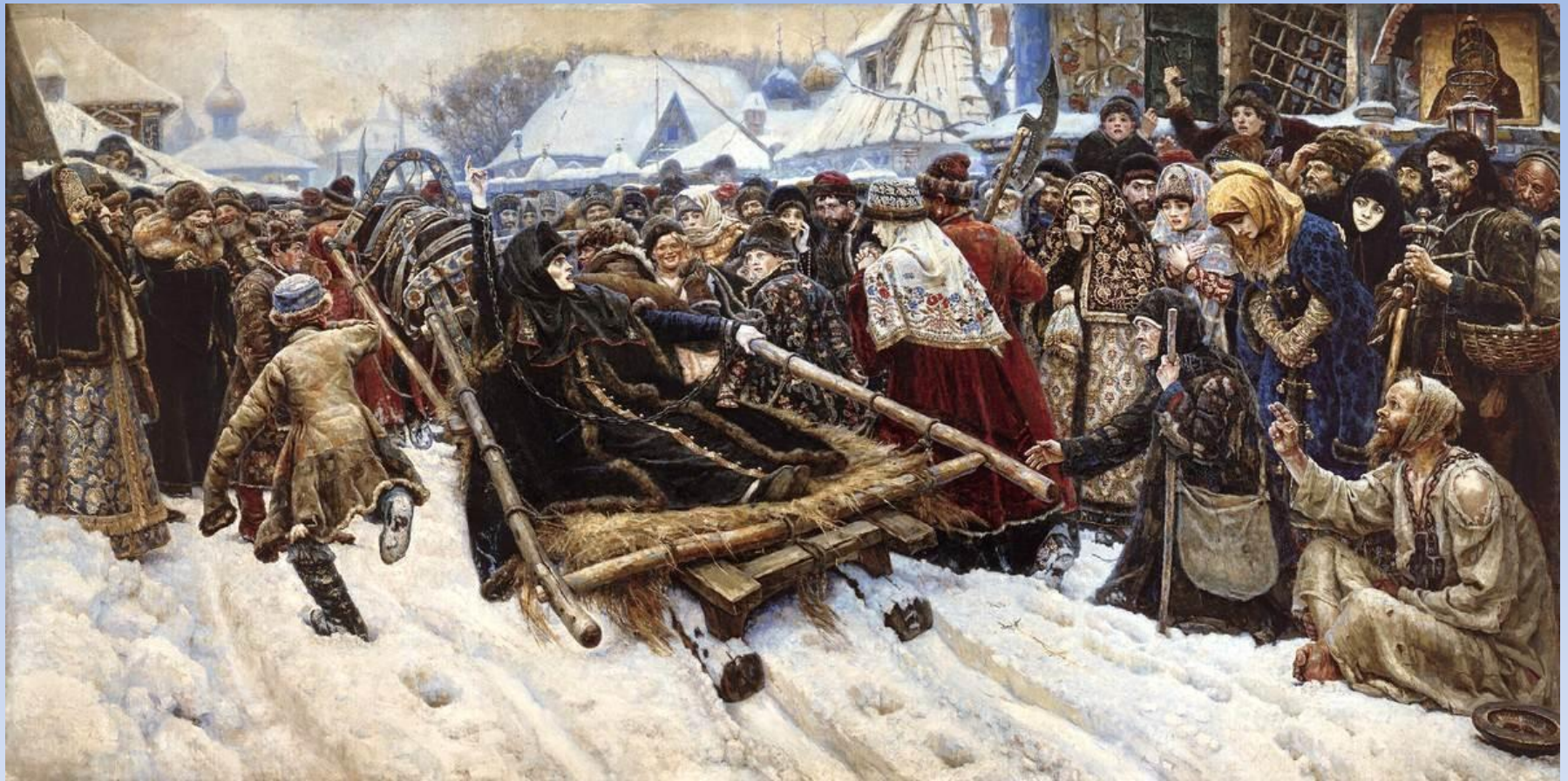
5.3. В.И.Суриков «Боярыня Морозова» 1887г.,х.,м., Государственная Третьяковская галерея