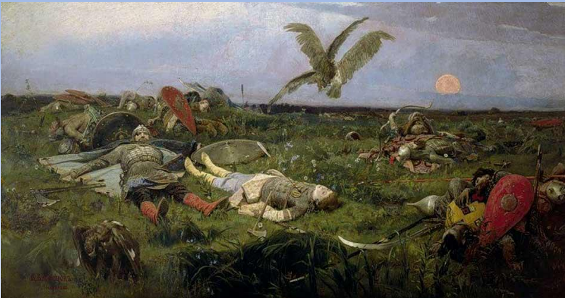
5.2. В.М.Васнецов «После побоища Игоря Святославовича с половцами» 1880г.,х.,м, Государственная Третьяковская галерея