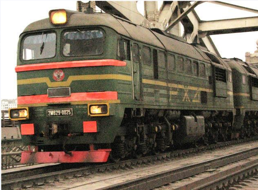
der Zug die Eisenbahn