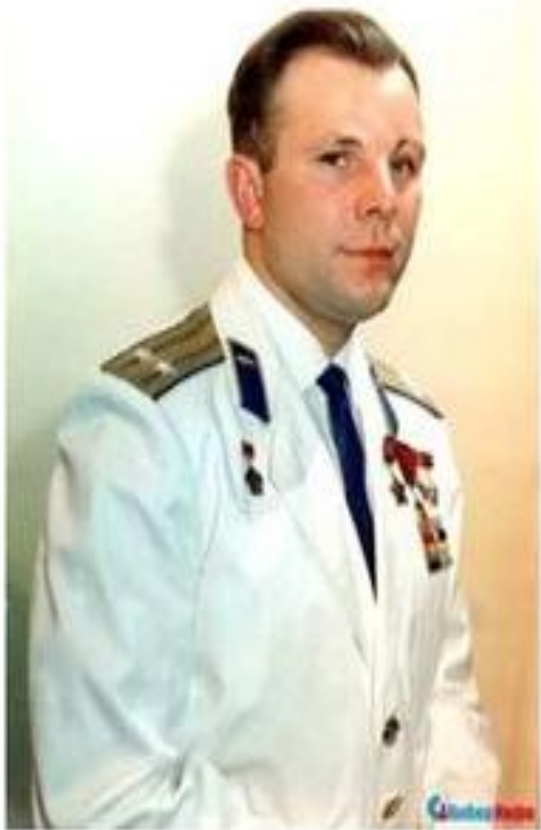
ГАГАРИН, ЮРИЙ АЛЕКСЕЕВИЧ (1934–1968), советский лётчик- космонавт, первый человек, совершивший орбитальный космический полет.

12 апреля 1961 года в 9 часов 6 минут 59,7 секунд с космодрома Байконур стартовал первый космический корабль с человеком на борту. На борту корабля находился лётчик-космонавт Ю. А. Гагарин. За 108 минут корабль совершил один виток вокруг Земли и выполнил посадку недалеко от деревни Смеловка Терновского района Саратовской области (ныне Энгельсский район).