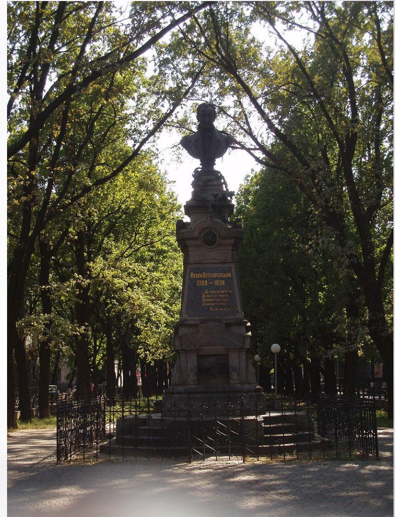
Пам'ятник Івану Котляревському (відкритий в 1903 році)