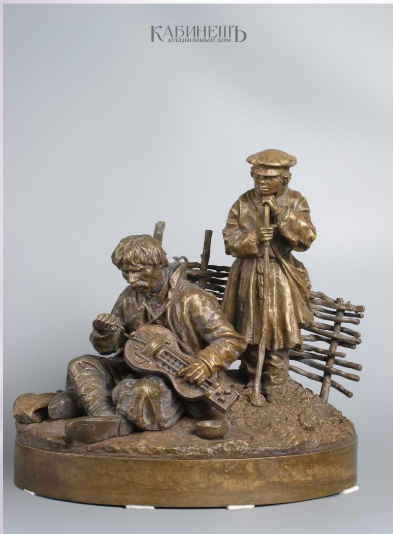
«Лірник (Кобзар)» (1883)