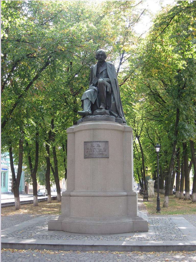
Пам'ятник Миколі Гоголю (виконаний в 1913 році, встановлений у 1934)