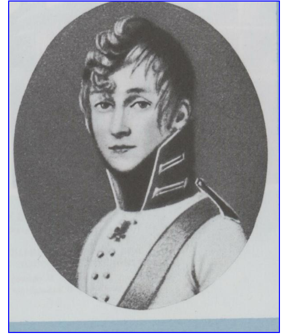
Отец: Сергей Николаевич

И.С.Тургенев родился 28 октября 1818 года в селе Спасском Орловской области. Семья будущего писателя жила деревенской, дворянской, медленной жизнью в обычной обстановке гувернеров и учителей, швейцаров и немцев.