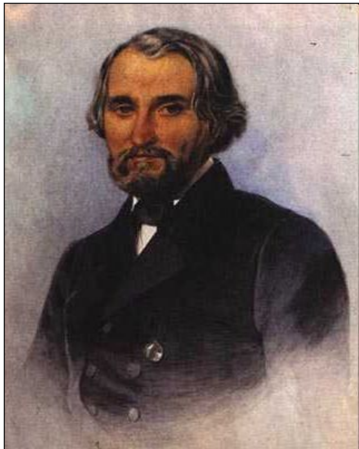
Иван Сергеевич Тургенев 1818 - 1883