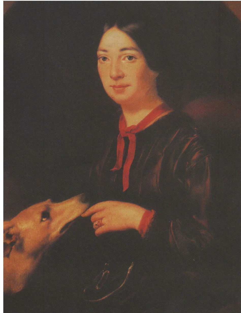
Е. А. Плюшар. Портрет П. Виардо-Гарсиа. Около 1853г

И.С.Тургенев – П.Виардо 28 октября 1850 г.