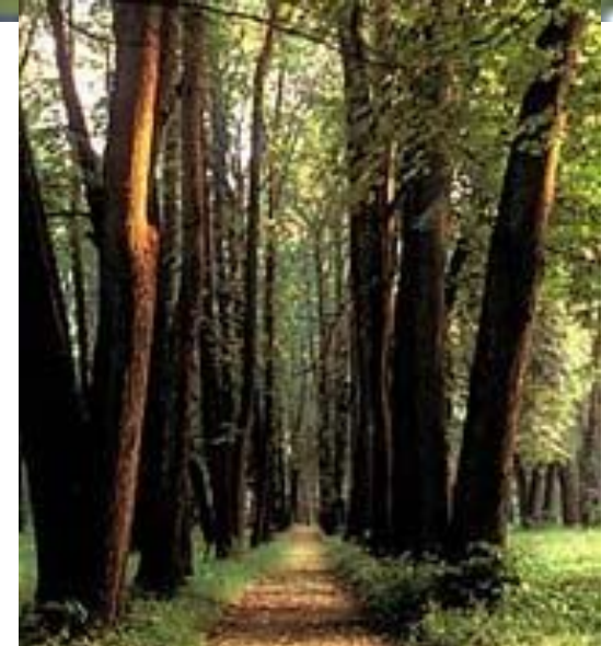
В.Колонтаева. «Воспоминания о селе Спасском».

...Спасское было в то время настоящим барским имением. Широкие, длинные аллеи из исполинских лип и берёз вели с разных сторон к господской усадьбе... за домом тянулся обширный, роскошный сад, густые, тёмные аллеи которого шли уступами к прудам, окаймлявшим сад и всю усадьбу.