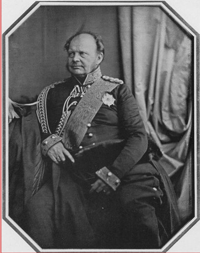
Фридрих Вильгельм IV - король Пруссии (1840-1861)

Король Фридрих Вильгельм IV отверг конституцию. Затем конституцию отвергли руководители многих германских государств.