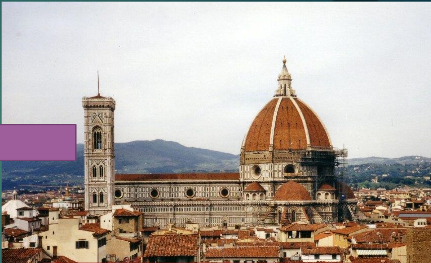
Санта-Марія-дель-Фьоре у Флоренції РЕНЕСАНС