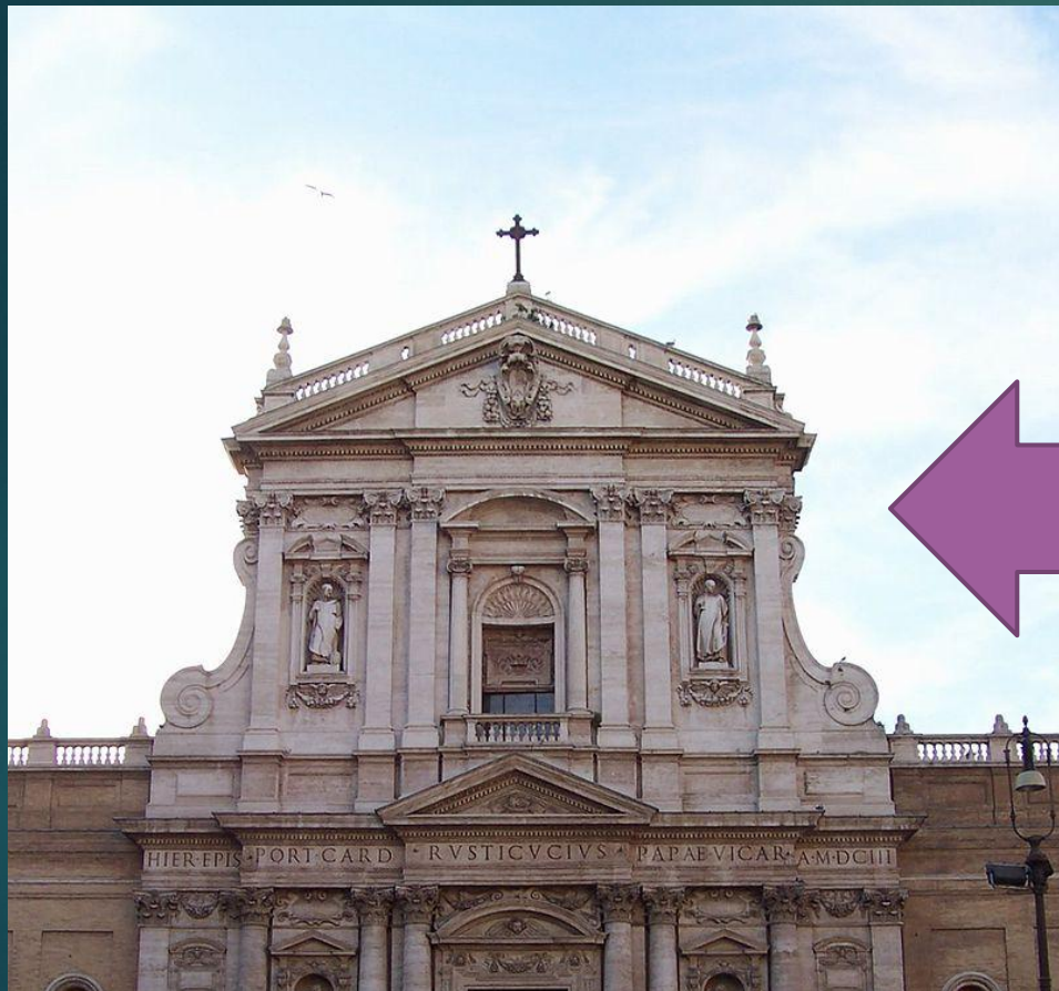
Собор Св. Сусанни у Римі БАРОКО