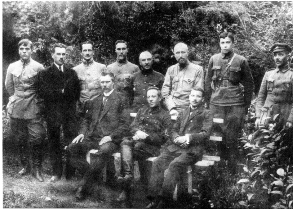
Керівники Директорії та Армії УНР. Кам'янець-Подільський, липень 1919 року. Сидять: Ф. Швешь, С.Петлюра, А.Макаренко. Стоять: ад'ютант Петлюри О.Доенко, нач. канцелярії М.Миронович, полк. Куликовський, сотн. Осеський (брат Наказного Отамана), генерал-квартирмейстер Генштабу Шайбле, військовий міністр В.Петрів, посильний Г.Швешь, начальник Головної юридичної управи Армії УНР Є.Мошинський(?)