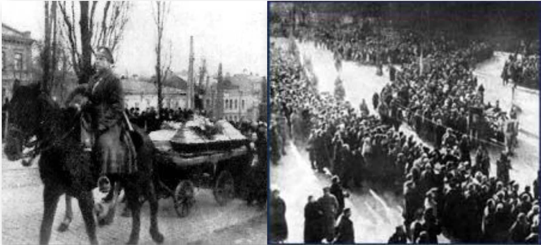
Урочисте перепоховання студентів у Києві 19 березня 1918