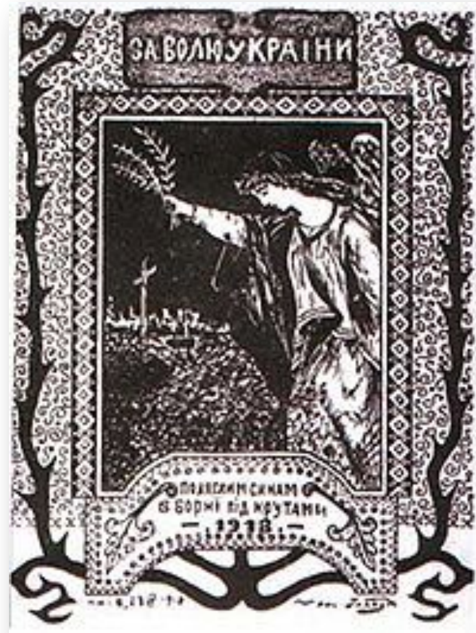
«За волю України. Полеглим синам в борні під Крутами» — київський плакат 1918 року

У Четвертому Універсалі уряд УНР закликав до боротьби з більшовицькими військами — а вже 5 січня 1918 р. на зборах студентів молодших курсів Київського університету св. Володимира і Українського народного університету було ухвалено створення студентського куреня Січових Стрільців.