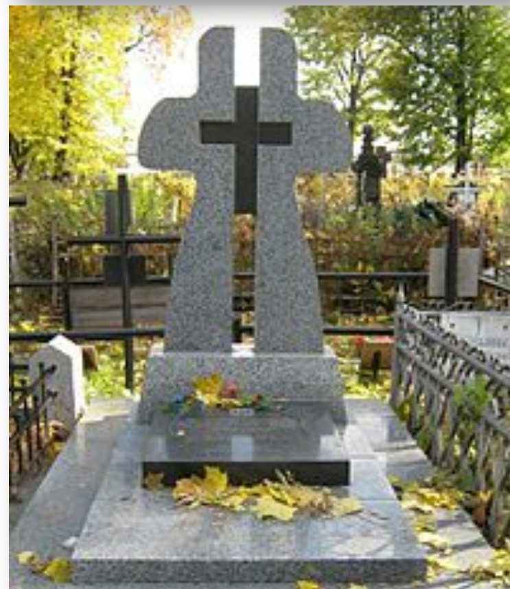
Могила бійців на Лук'янівському цвинтарі