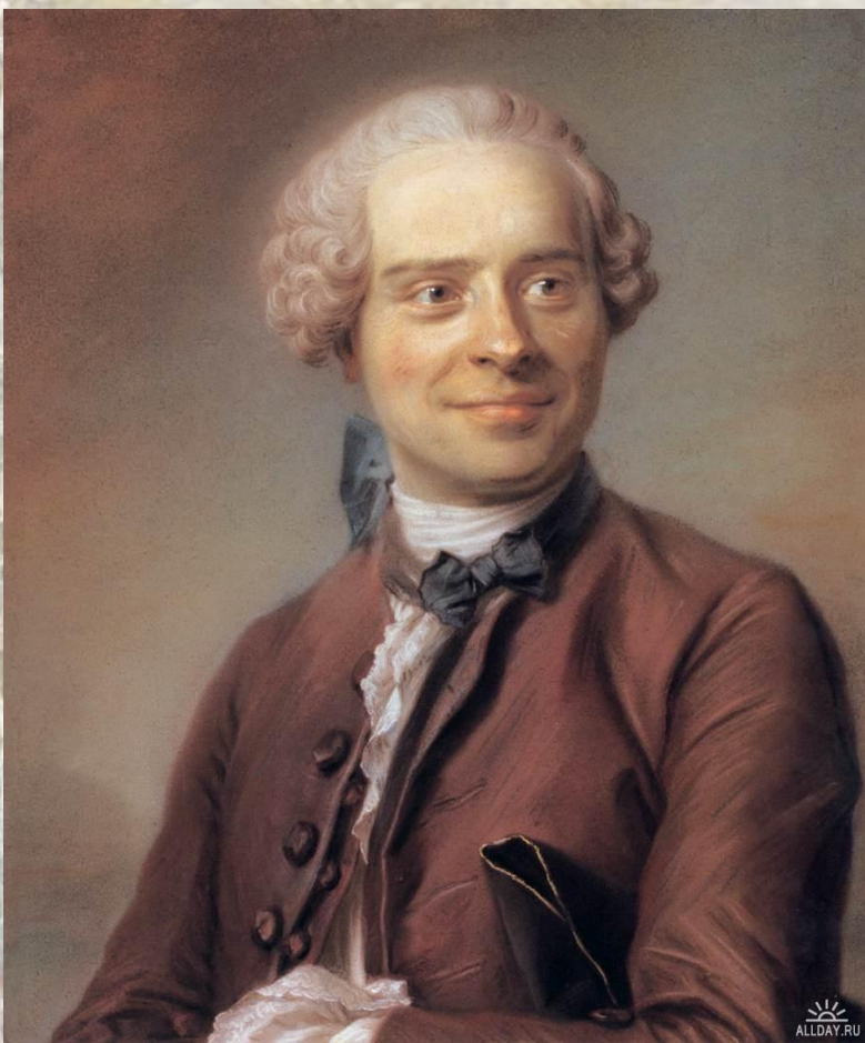
Жан Лерон Д'Аламбер