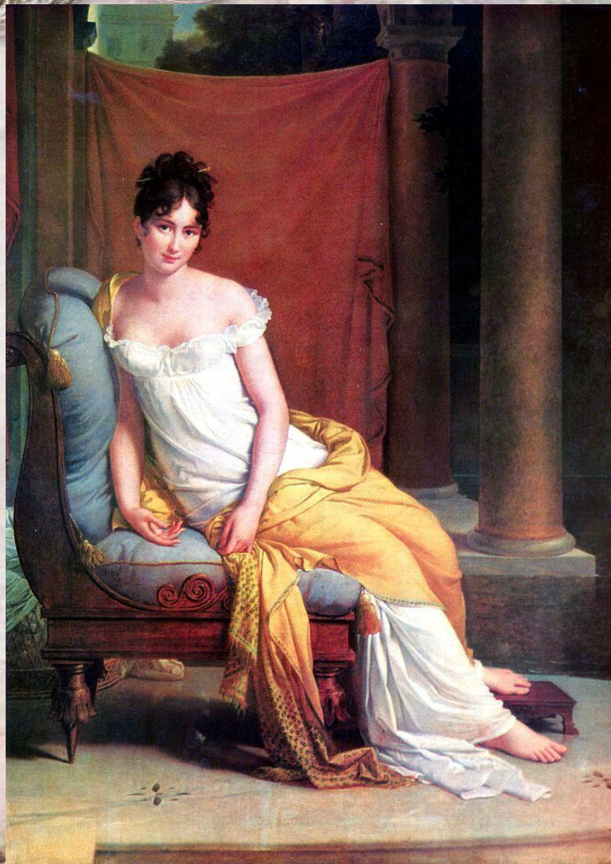
Франсуа Жерар, «Портрет мадам Рекамье», 1802.