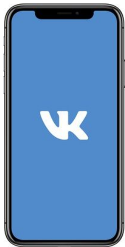
VK для iPhone