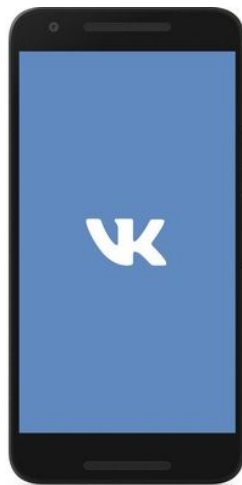
VK для Android