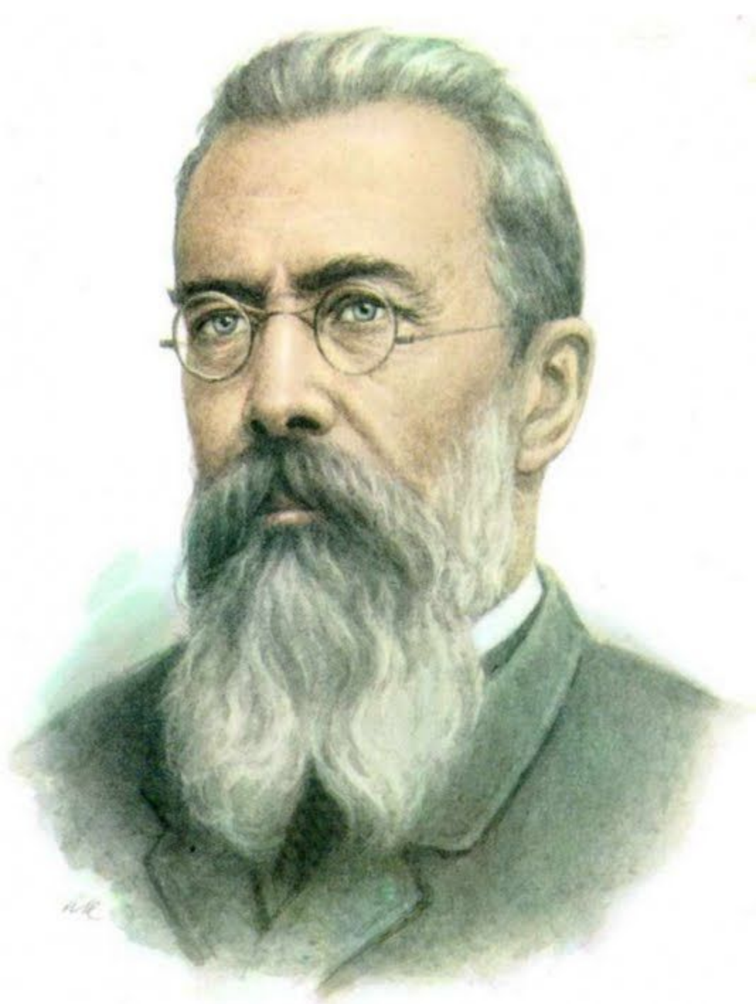
Н.А. Римский- Корсаков