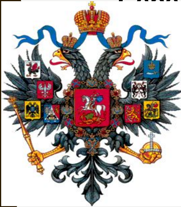
Рисунок Малого герба России, исполненный Александром Фадеевым, был высочайше утвержден 8 декабря 1856 года.

Этот вариант герба отличался от предшествующих не только изображением орла, но и количеством "титульных" гербов на крыльях.