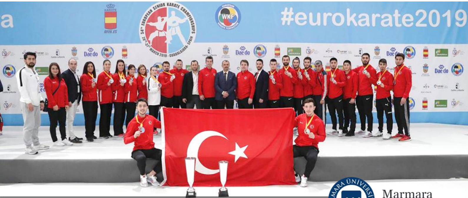
Marmara Üniversitesi Sporcular Türkiye'nin Gururu oldu.