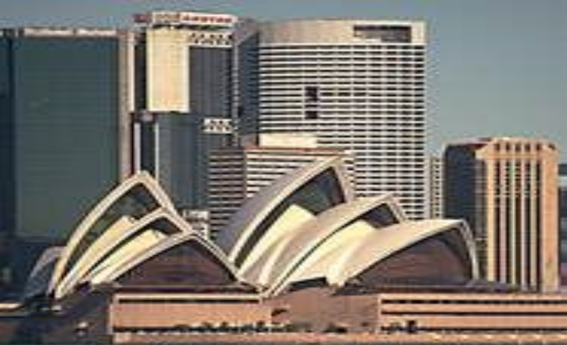
Вид из гавани на Сиднейскую оперу