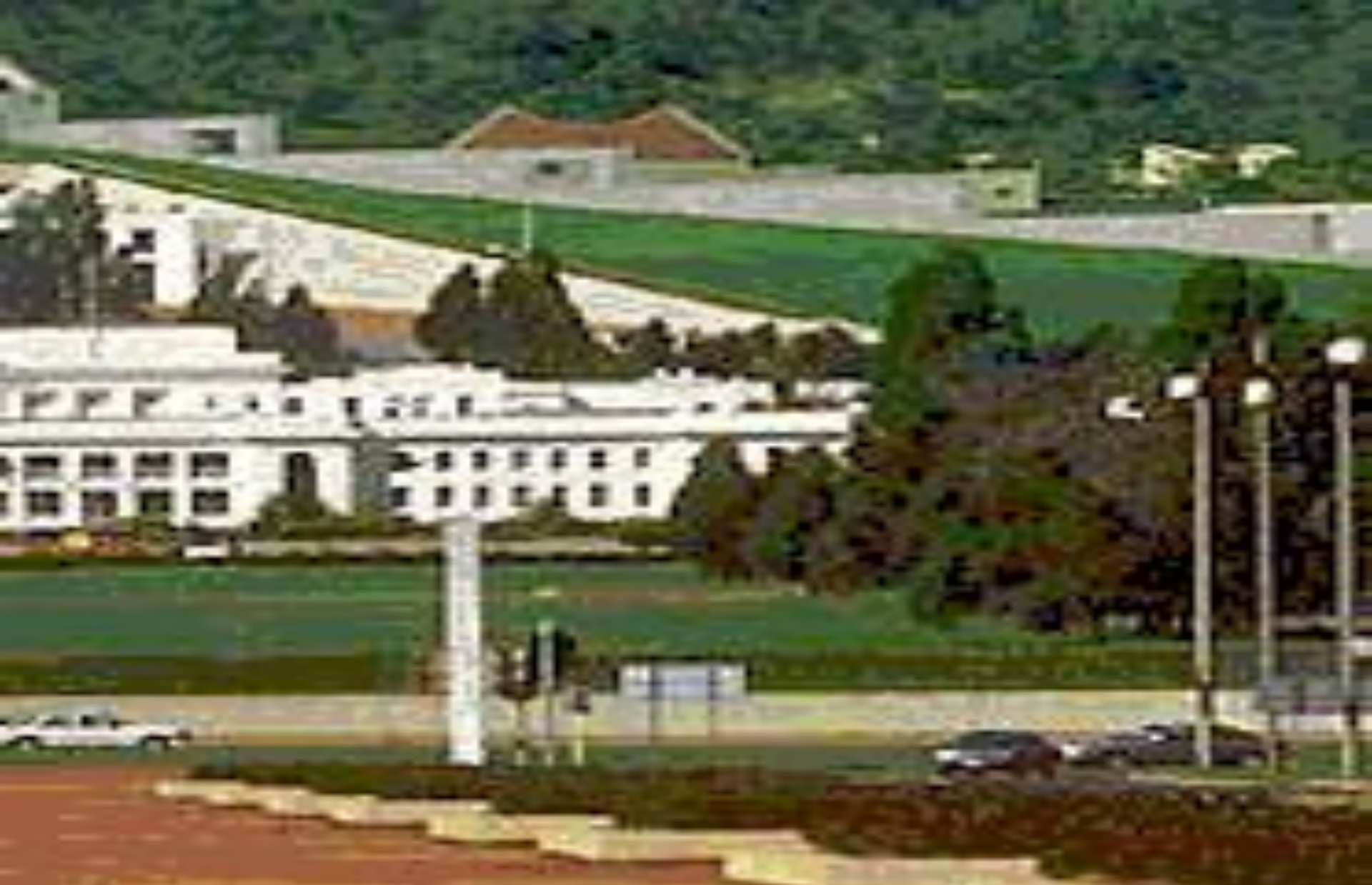
Сидней. Здание Парламента.