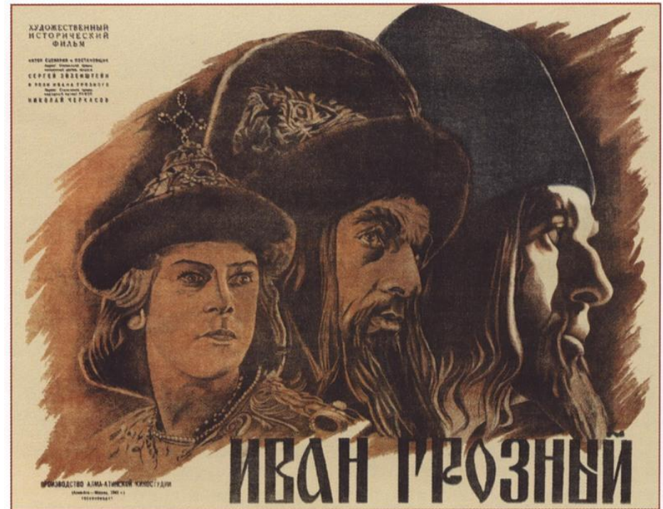
574. Длугач М. Иван Грозный. Реж. С.Эйзенштейн. 1945