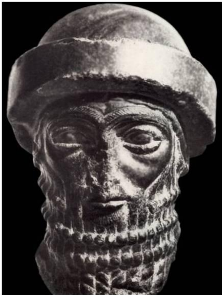
Хаммурапи - царь Вавилона