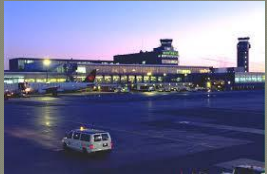
Важливий аеропорт – Монреаль