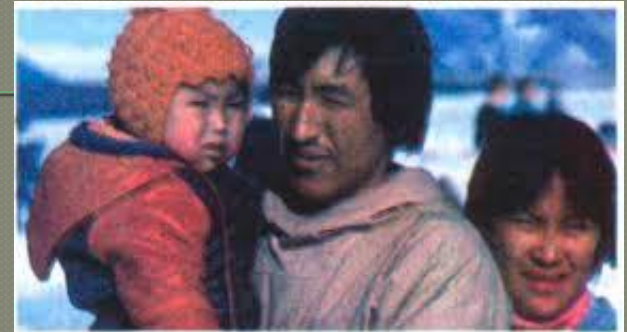
Мал. 211. Ескімоси

В Канаді присутня велика українська діаспора(близько 1,2 млн. осіб).