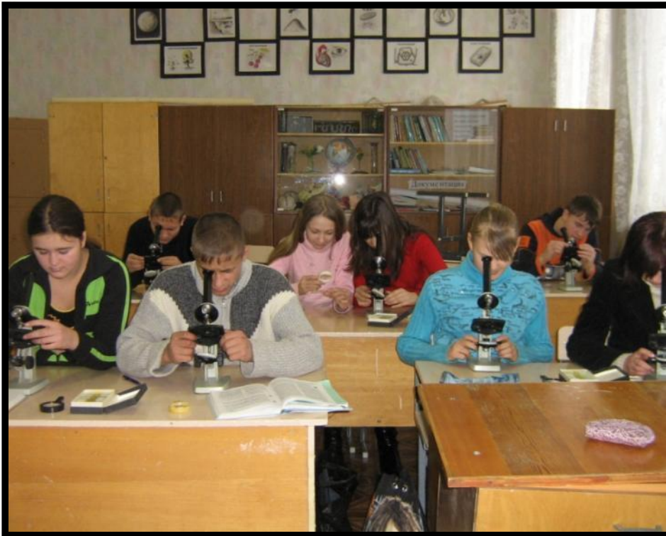
Место и значение экскурсий в процессе познания

Экскурсия - это форма организации работы, при которой школьники выходят на место расположения изучаемых объектов (природы, исторических памятников, производства) для непосредственного ознакомления с ними. Такая форма работы позволяет организовать наблюдение и изучение различных предметов и явлений в естественных условиях. Экскурсии по биологии и экологии позволяют добиться прочных, осознанных знаний, установить связь теории с практикой в процессе обучения.