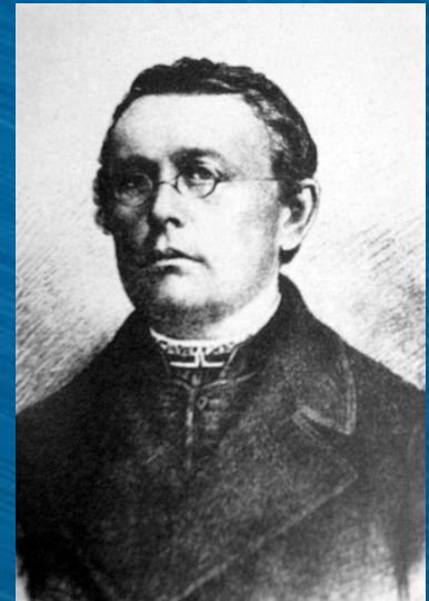
Михайло Вербицький, автор музики гімну

У 1862 році з'явився вірш відомого етнографа Павла Чубинського “Ще не вмерла Україна”. Вірш був покладений на музику Михайлом Вербицьким і невдовзі став новим національним гімном. Музичну редакцію національного гімну було затверджено 15 січня 1992 року Указом Президії Верховної Ради України. А 6 березня 2003 року Указом Президента України Державним Гімном України затверджено національний гімн на музику М. Вербицького зі словами першого куплету та приспіву твору П. Чубинського в такій редакції.