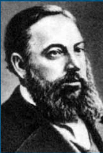
Павло Чубинський, автор слів гімну