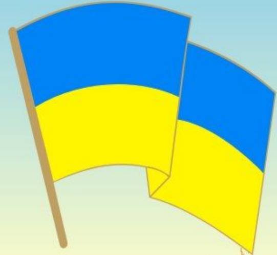
ДЕРЖАВНИЙ ПРАПОР УКРАЇНИ

Послухай, як струмок дзвенить, Як гомонить ліщина. З тобою всюди, кожна мить Говорить Україна.