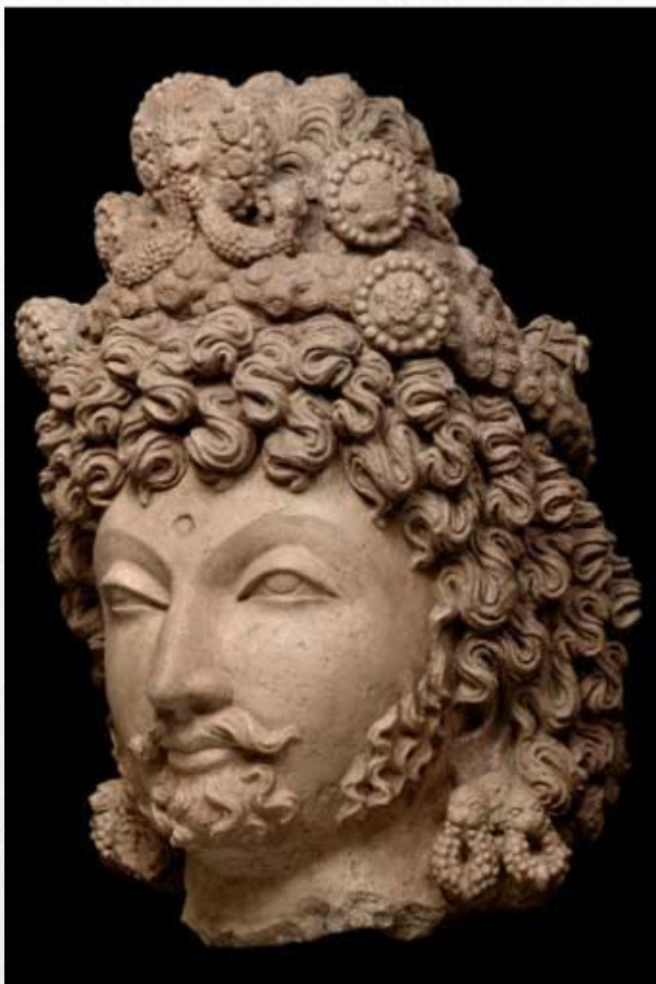
голова Бодхисаттвы (Гандхара)