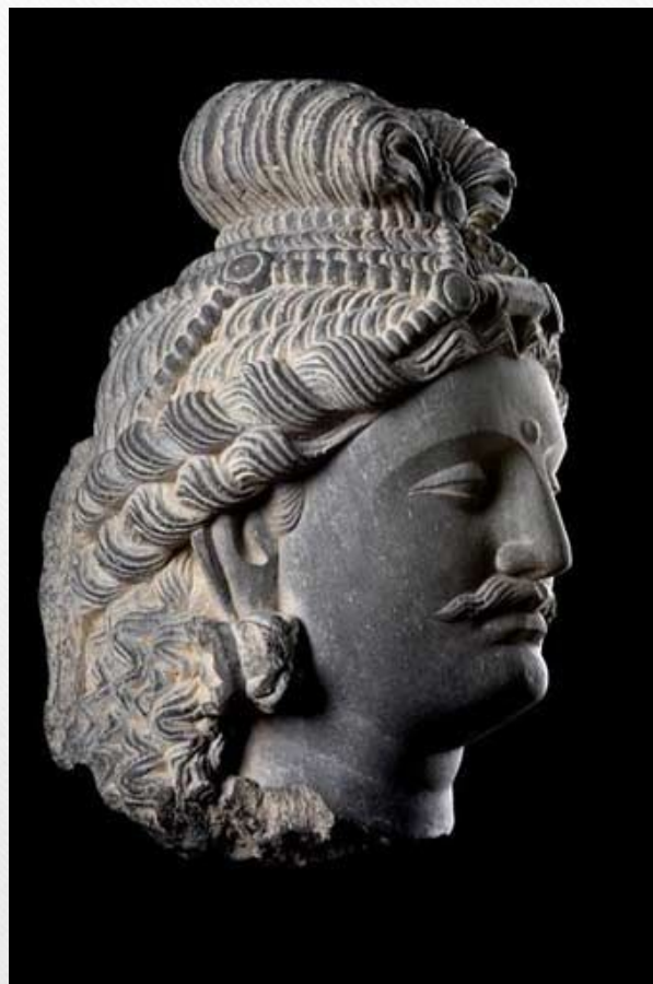
голова Бодхисаттвы (Гандхара)