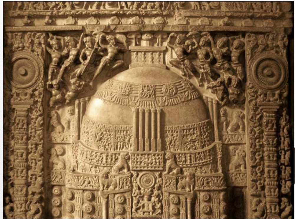
фрагмент ступы из Амаравати

В период правления южноиндийской династии Сатаваханов (конец III в. до н.э. - III в. н.э.) зародилась скульптурная школа Амаравати, названная так в честь города, где она была основана. Эта школа известна повествовательными барельефами и массовыми сценами из жизни людей и богов. Данный стиль является синтезом северного и южного скульптурного искусства.