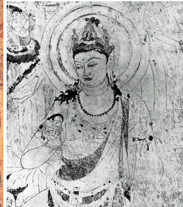
Портрет Будды в храме Хорю-дзи