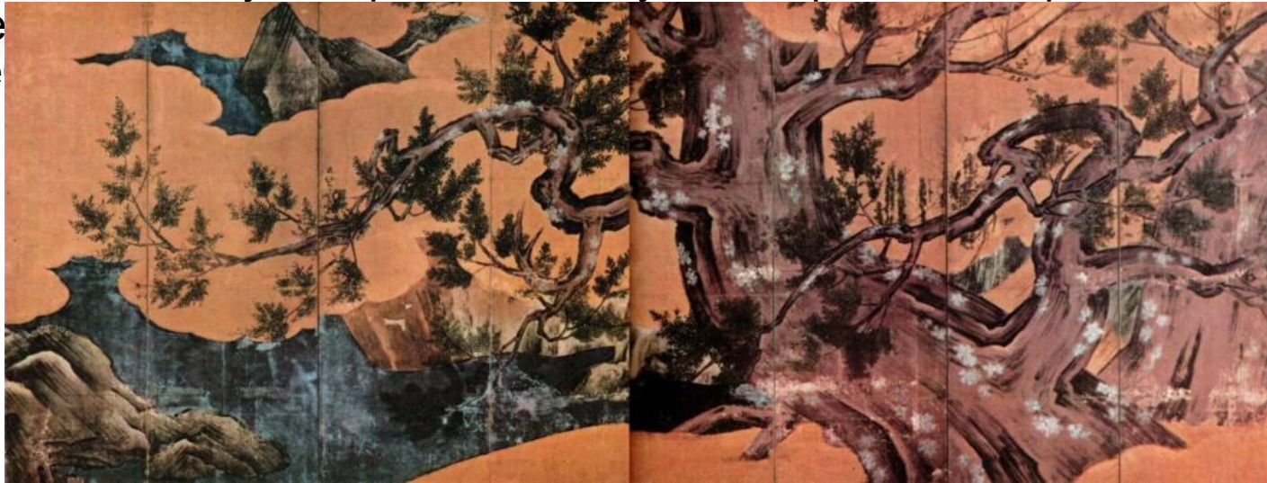
Кипарис. Ширма. Кано Эйтоку.

Данный период является полной противоположностью своему предшественнику. Из произведений уходит мрак и монохромность, замечается