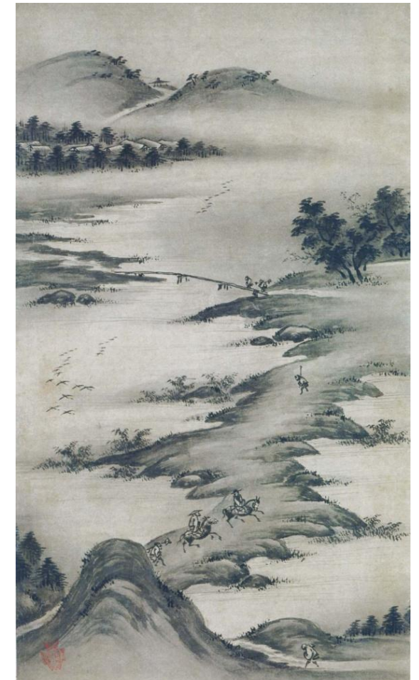
Летний пейзаж. Кано Жидзёри