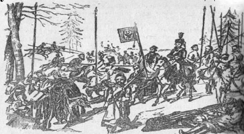
Атаман Платов на походе. Со старинного рисунка.

Герой Отечественной войны 1812, генерал от кавалерии, граф (с 1812), войсковой атаман Донского казачьего войска. Платов оставался на этой должности до своей смерти, покидая Дон лишь для участия в войнах. В сражении при Бородине 26 августа 1812 совершил успешный рейд в тыл французской армии, чем приостановил на два часа атаки противника на центр обороны русских войск (батарею Раевского). Покидая пределы России, Наполеон признавал, что именно казаки уничтожили конницу и артиллерию отступавшей французской армии. В Польше он изрек фразу, ставшую известной: "Дайте мне одних лишь казаков, и я покорю всю Европу". После победного сражения за польский город Данциг Кутузов писал Платову: "Услуги, оказанные Вами отечеству в продолжении нынешней кампании, не имеют примеров! Вы доказали целой Европе могущество и силу обитателей благословенного Дона".