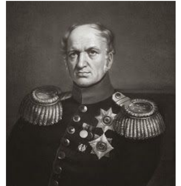
Канкрин Егор Францевич

в 1839 году установлена система серебряного монометаллизма - серебряный рубль становится главной денежной единицей. Государственным ассигнациям отводилась роль вспомогательного денежного знака.