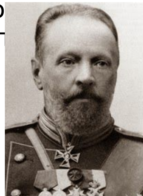
Витте Сергей Юльевич (1849-1915)

Этот период в финансовой истории России называется периодом золотого монометаллизма.