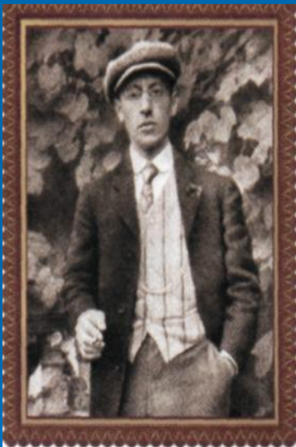
И. Ф. Стравинский (1882-1971)

- русский композитор. Он родился в Петербурге, в семье известного певца. Музыкальная обстановка в семье, встречи с выдающимися музыкантами, знакомство с богатой библиотекой отца, посещение оперного театра - всё это способствовало раннему увлечению мальчика музыкой. К 10 годам он хорошо играл на рояле и начал сочинять музыку. Занятия в юношеские годы с Н. А. Римским-Корсаковым завершили музыкальное образование И. Стравинского.