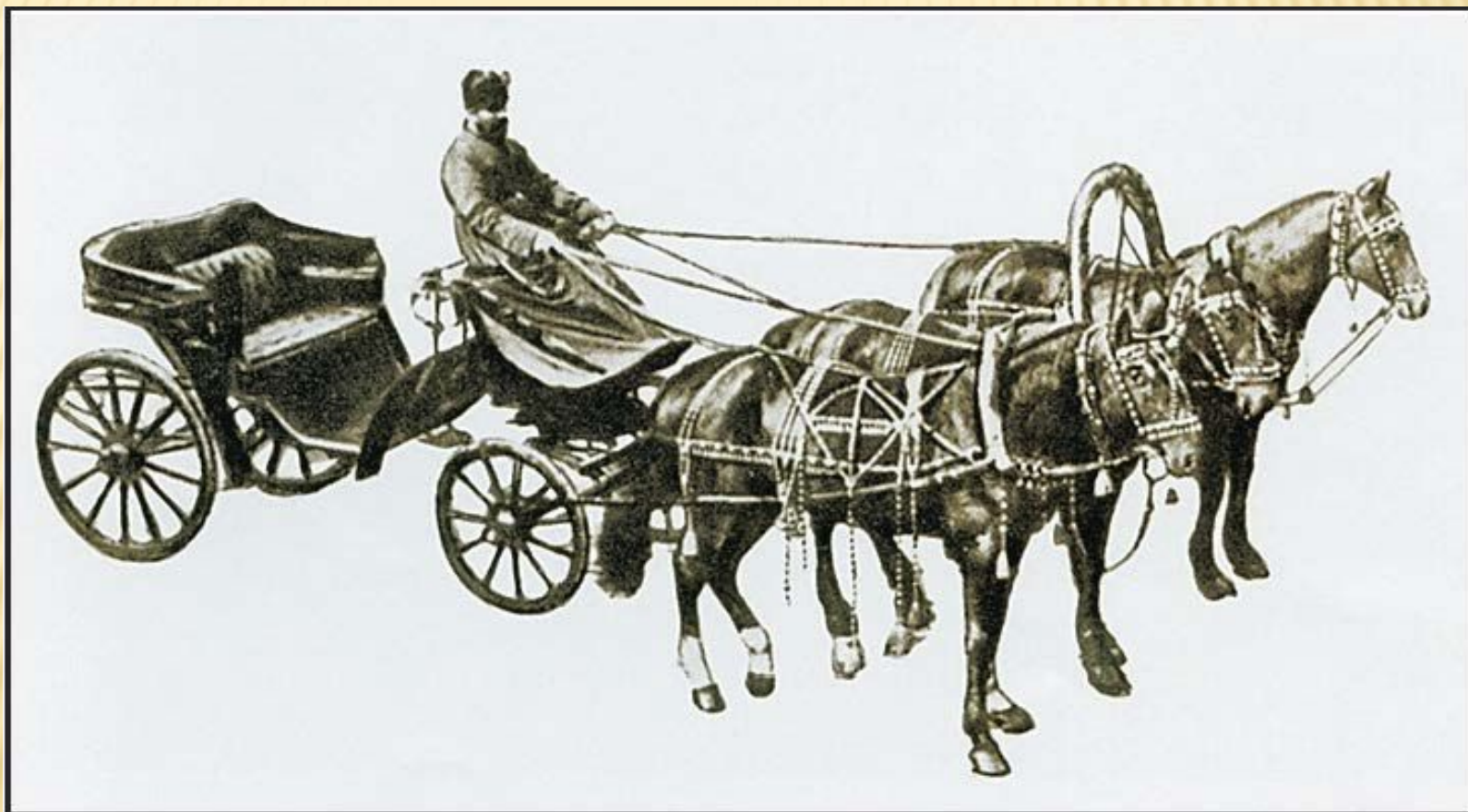
Ямщик. Фотография конца XIX в.