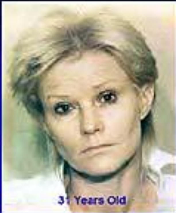
31 Years Old