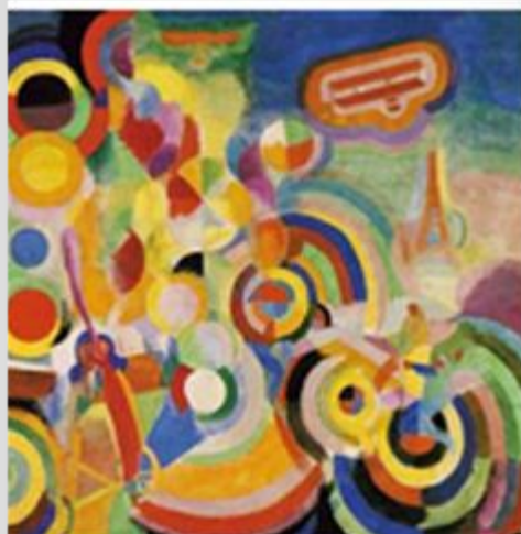
Р. Делоне. С уважением к Блерио

Абстрактный цветовой ритм возбуждал эмоции зрителей. Взаимопроникновение основных цветов спектра и пересечение криволинейных поверхностей в работах Делоне создают динамику и истинно музыкальное развитие ритма. Одним из первых его произведений стал цветной диск, по форме напоминающий мишень, но цветовые переходы составляющих его соседних элементов имеют дополнительные цвета, что придает диску необычайную энергию.