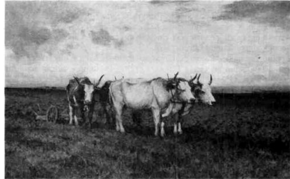
С. Світославський. Воли на ниві