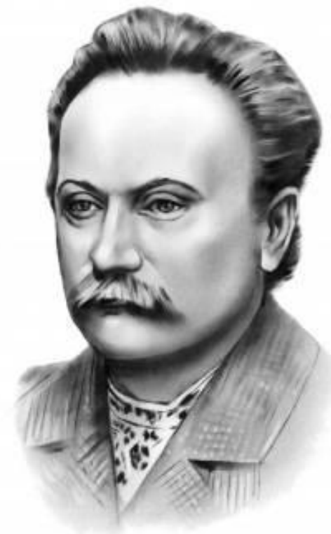
Іван Франко (1856—1916)