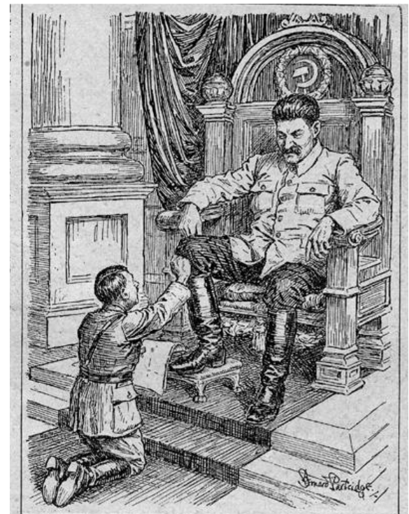
THE LITTLE RED FATHER. "Heil Kamerad! Now that I've dealt with Poland, tell me what peace terms I am to dictate to the Democracies." From the cartoon by Sir Bernard Patridge. By permission of the Proprietors of "Punch"