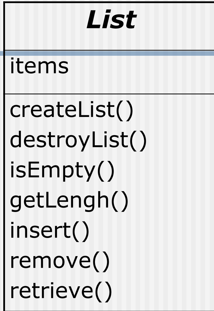
Диаграмма абстрактного списка