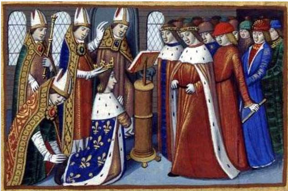
Коронация Карла VII в Реймсе

Но пока Карл не был коронован, он не считался законным королем. Жанна убедила его выступить в поход на Реймс — город, где издавна короновались французские короли. Весь путь до Реймса в 300 км армия прошла за две недели. Наследник престола был коронован в Реймском соборе. Вблизи короля со знаменем в руках стояла в рыцарских доспехах Жанна.