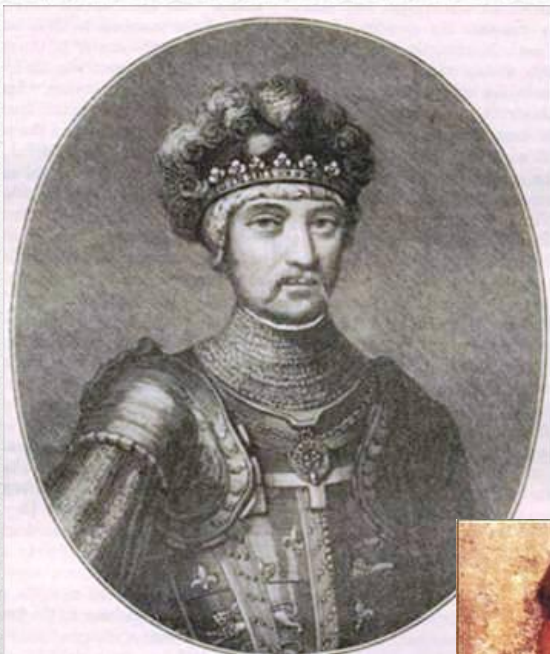
Эдуард «Черный принц»

Вторжения английских войск во Францию принесли им богатую добычу: деньги, оружие, драгоценности, а также выкупы за богатых пленников. Награбленная добыча рекой потекла в Англию. Немудрено, что эту войну одобряли в Англии разные слои населения.