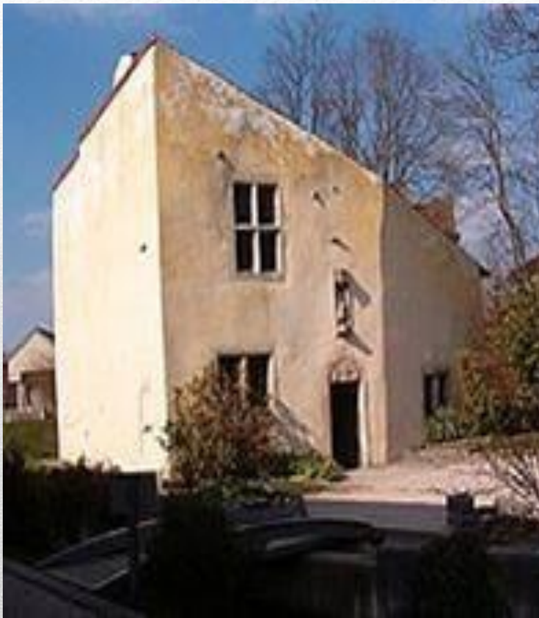
Дом в Дореме, в котором родилась Жанна

В подъеме народной борьбы против захватчиков и их изгнании большую роль сыграла Жанна д'Арк . По описанию современников, это была высокая, сильная и выносливая крестьянская девушка-пастушка. Будучи безграмотной, она, однако, обладала быстрым, находчивым умом и превосходной памятью, хорошо ориентировалась в сложной обстановке. Она была убеждена, что ей предназначено Богом спасти родину от врага. Ей не было и 18 лет, когда она покинула родные места, чтобы участвовать в борьбе с англичанами. Жанна сказала: «Никто на свете... не спасет королевство французское и не поможет ему, кроме меня». Жанна прежде всего хотела доказать: Бог желает ухода англичан из ее страны.