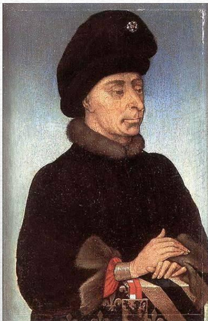
Иоанн Бесстрашный, герцог Бургундский