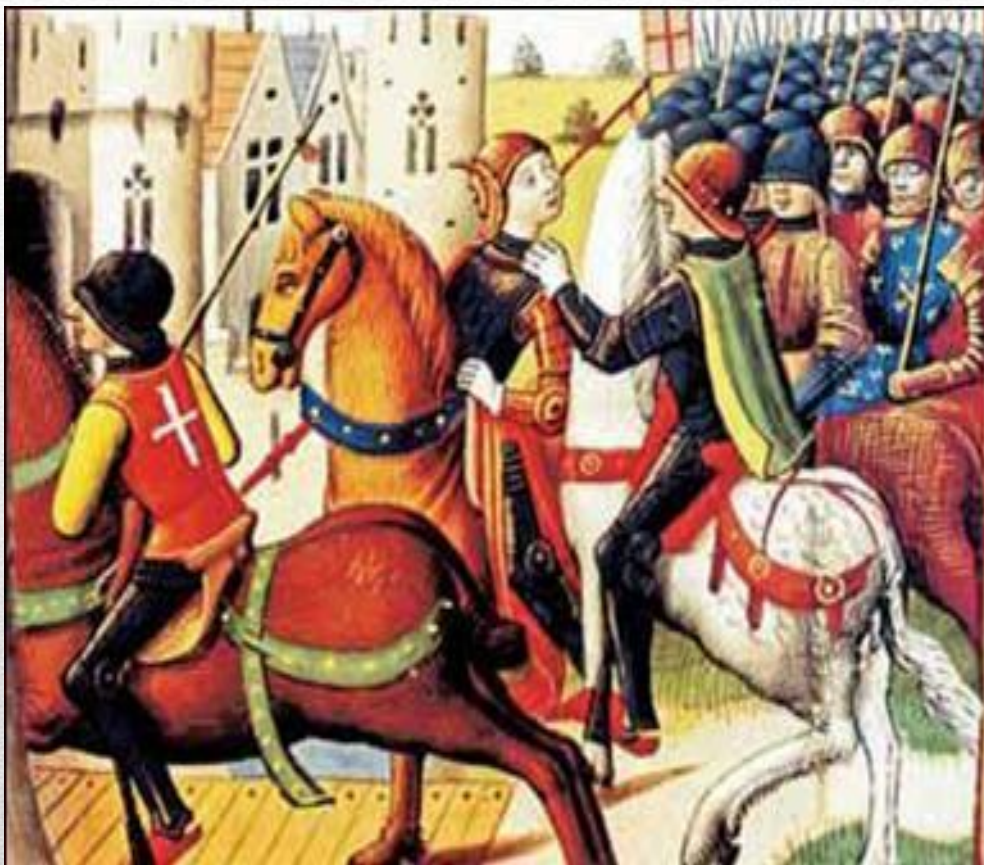
Пленение Жанны д'Арк

Необычный успех и слава крестьянской девушки вызывали зависть у знатных господ. Они хотели оттеснить Жанну от руководства военными действиями, избавиться от нее.