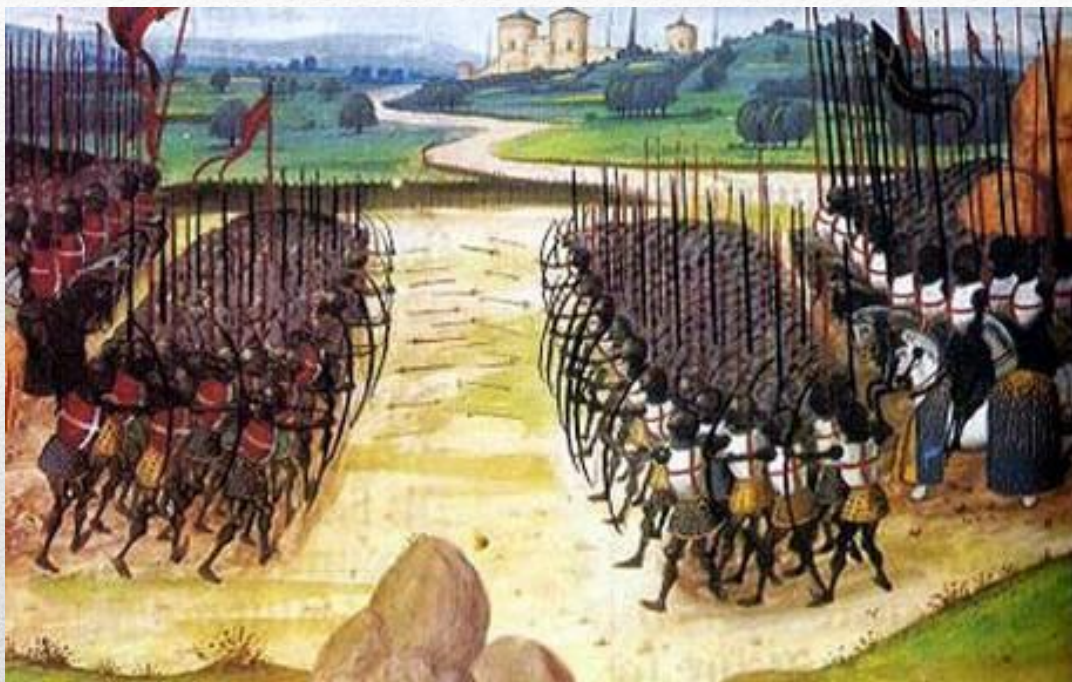
Миниатюра изображающая битву при Азенкуре

В 1415 году большое английское войско высадилось в устье Сены и направилось к Кале. У деревни Азенкур , в 60 км от Кале, французская армия вновь была разгромлена и бежала с поля боя. Погибло много рыцарей, полторы тысячи попали в плен. Поражение было воспринято как «очень большой позор для Французского королевства» .