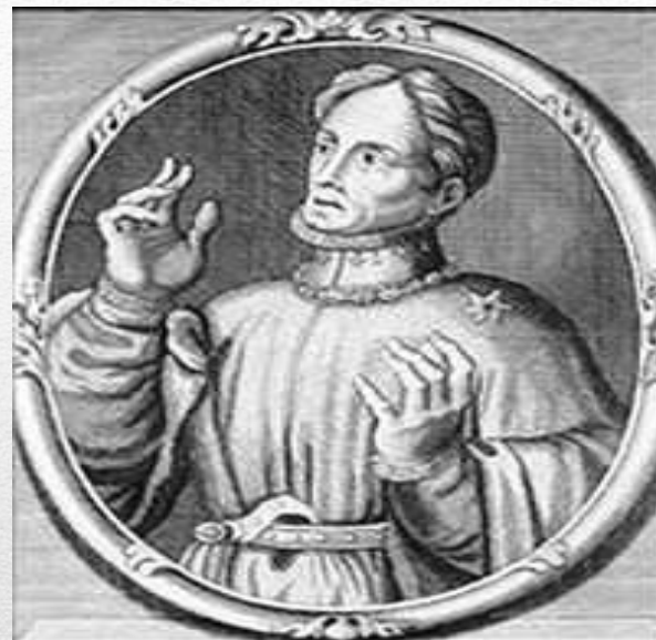
Людовик, герцог Орлеанский

Однако в конце XIV века положение Франции вновь осложнилось. Страну раздирала борьба двух феодальных групп за власть и влияние на психически больного короля. Во главе их стояли дяди короля — герцог Бургундский и герцог Орлеанский (с его близким родственником графом Арманьяком). Поэтому междоусобные распри были названы войной бургундцев с арманьяками .