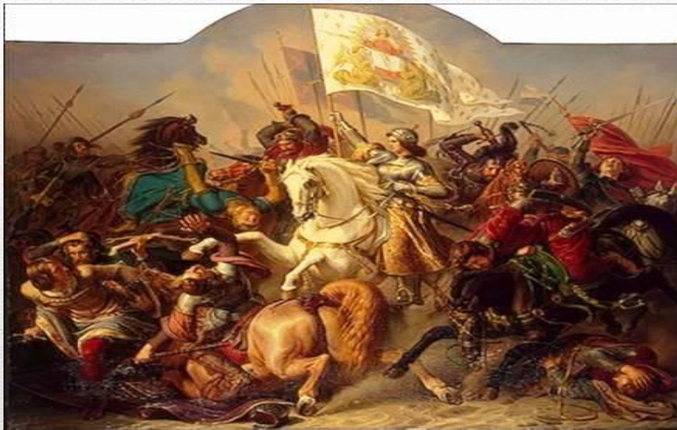
Жанна в бою

Перед походом Жанна д'Арк послала письмо англичанам, стоявшим под стенами Орлеана. Она требовала отдать ей ключи от всех захваченных городов и предлагала мир, если англичане уйдут из Франции и возместят причинённый ущерб. В противном случае Жанна грозила врагам «учинить такой разгром, какого не видели во Франции уже тысячу лет».