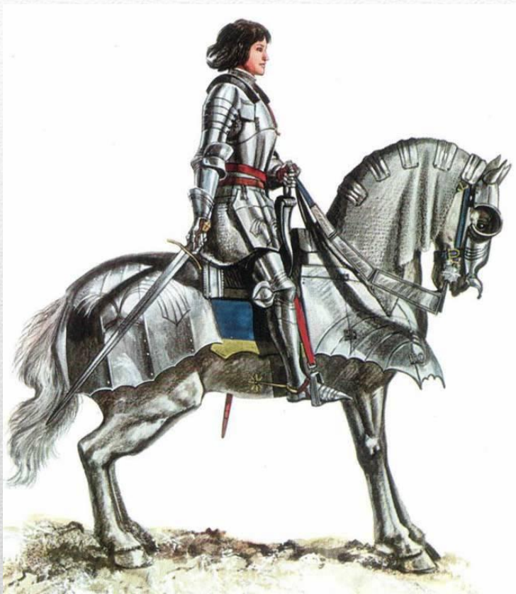
Жанна д'Арк в доспехе Реконструкция

Много трудностей пришлось преодолеть Жанне, чтобы принять участие в войне, которая считалась делом мужчин. В ближайшем городке ей удалось убедить коменданта крепости помочь ей. Он дал ей мужскую одежду, оружие и несколько воинов для сопровождения.