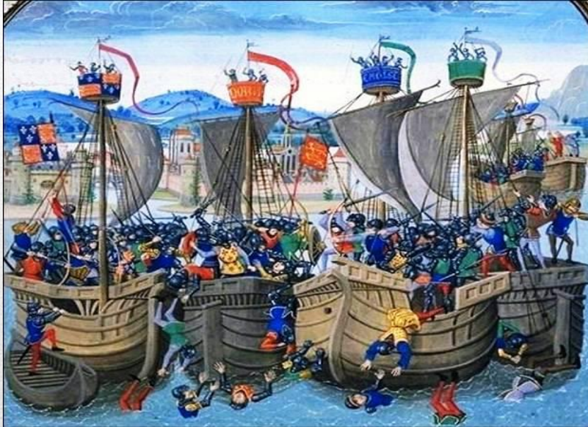
Битва при Слейсе

Располагая сильным флотом, английское войско переправилось через Ла-Манш. В 1340 году в морском сражении в узком проливе при Слэйсе у берегов Фландрии англичане разгромили французский флот, уцелели лишь немногие суда.