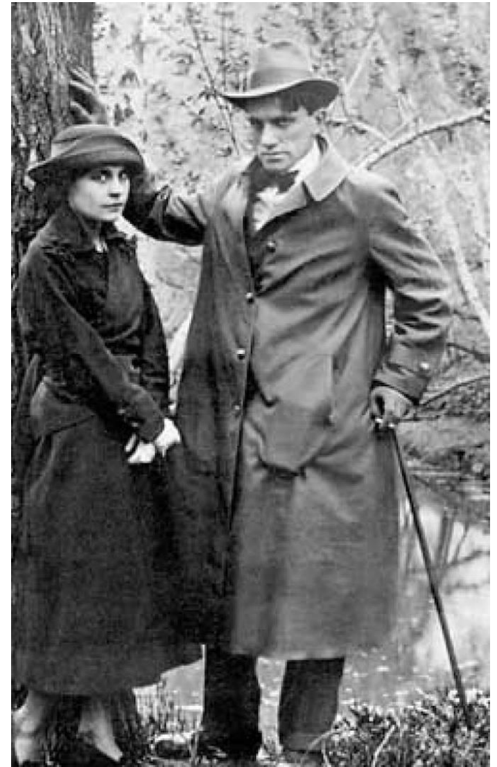
В. В. Маяковский и Л. Ю. Брик