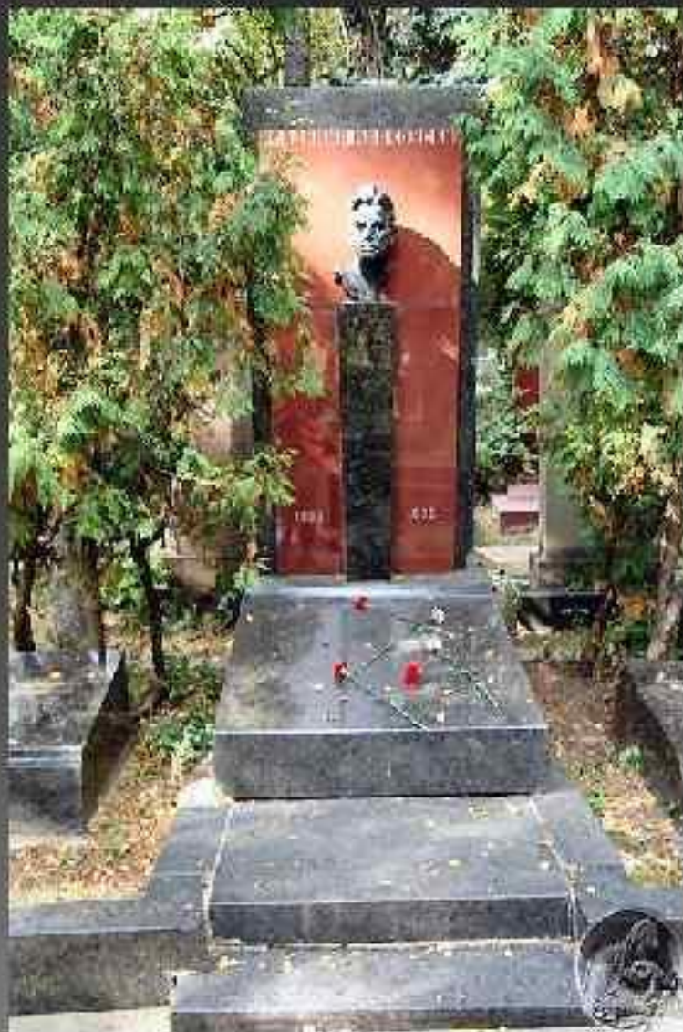
Могила Маяковского в Москве на Новодевичьем кладбище