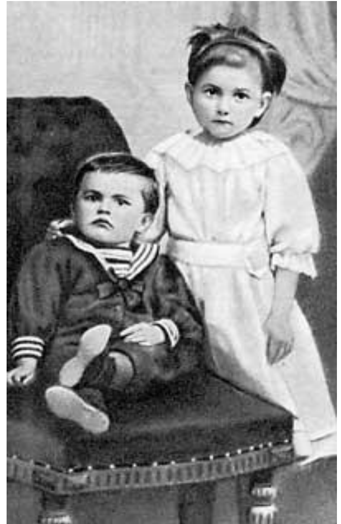
Володя Маяковский с сестрой Олей. 1896 г.