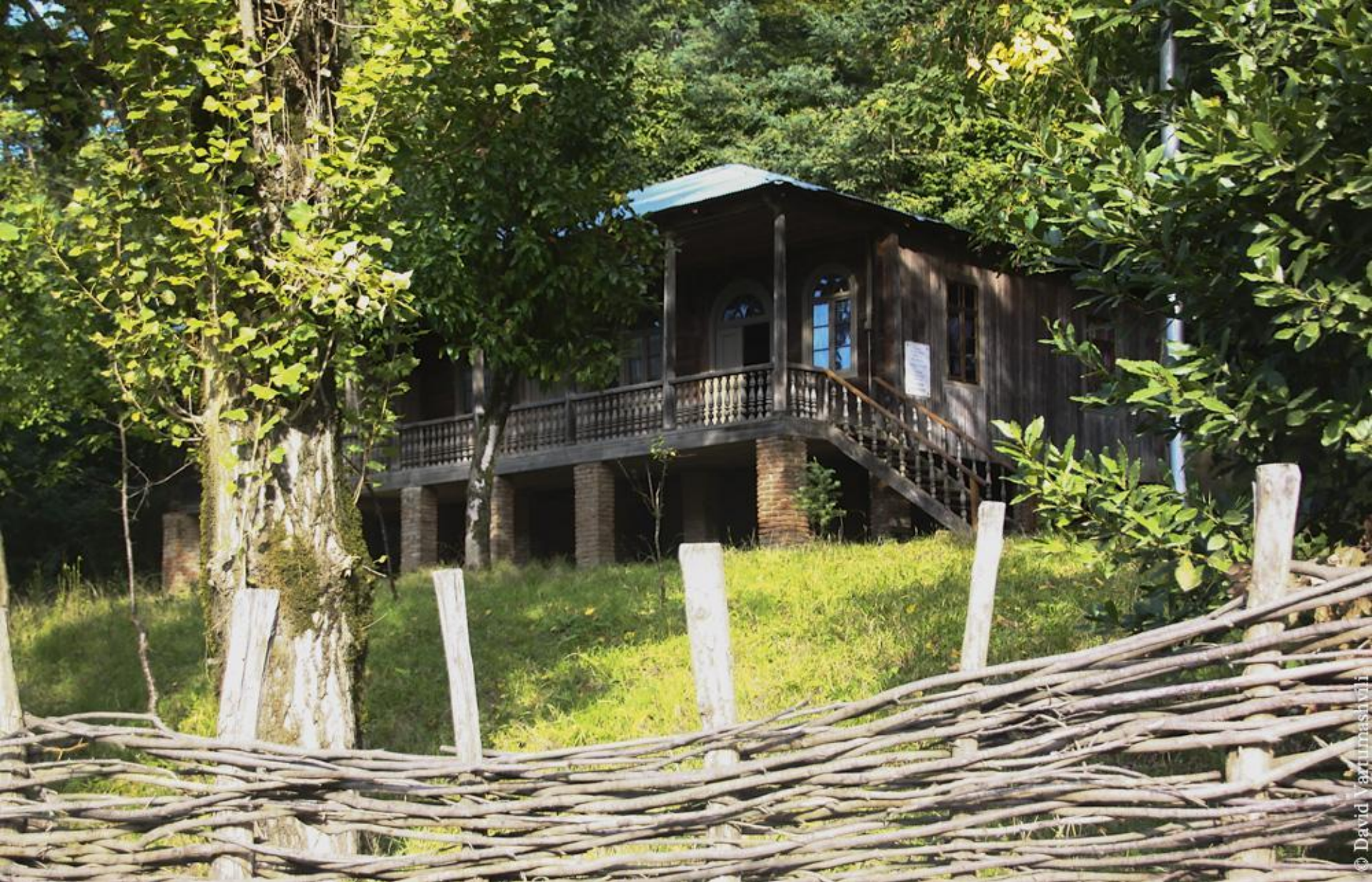
Дом, где родился В. В. Маяковский