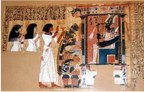
Часть древнеегипетской книги мёртвых в Лувре